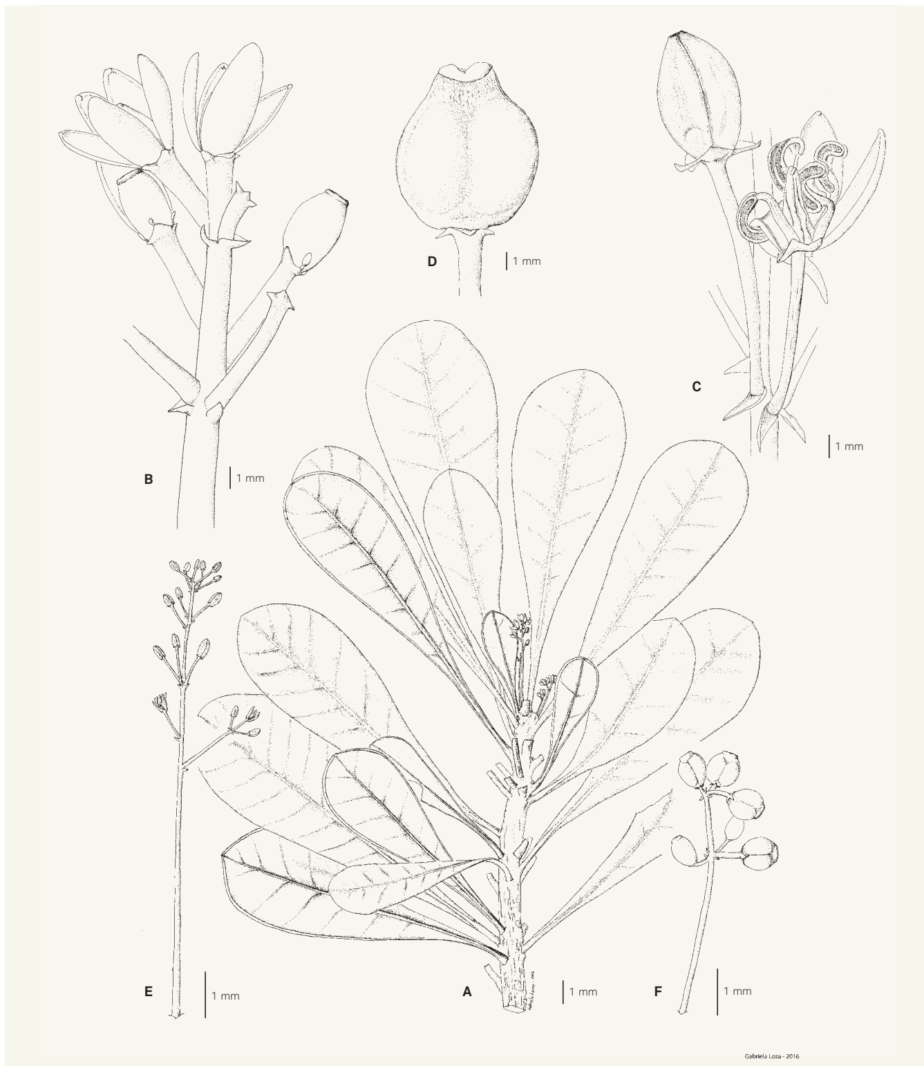
Fig. 1 – Phelline barrieriei Barriera & Schlüssel. A. Rameau femelle; B. Fleurs femelles; C. Fleurs mâles; D. Fruit immature; E. Inflorescence mâle; F. Jeune infrutescence. [A-B: Callmander et al. 1262, G; C, E: Morat 5043, P; D, F: MacKee 27072, P] [Illustration: Gabriela Loza]