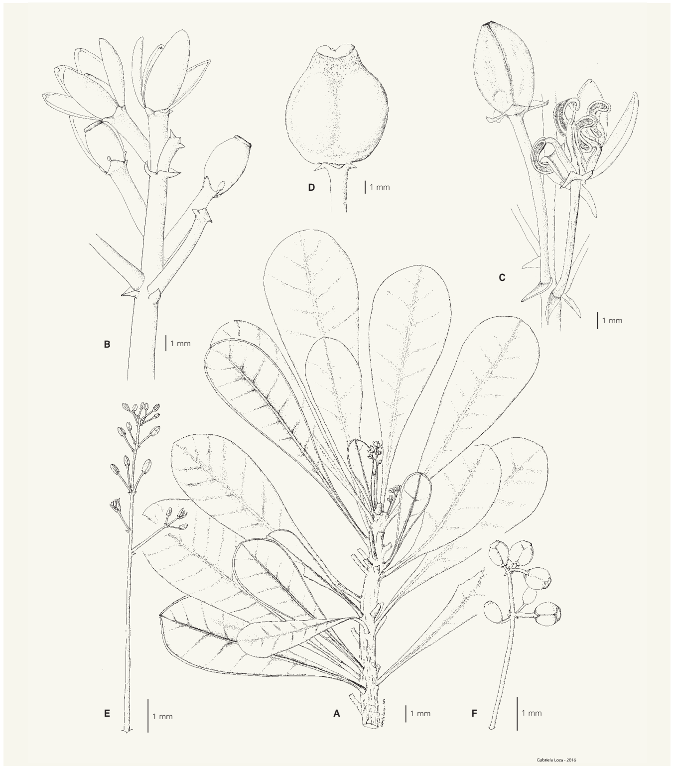
Fig. 1 – Phelline barrieriei Barriera & Schlüssel. A. Rameau femelle; B. Fleurs femelles; C. Fleurs mâles; D. Fruit immature; E. Inflorescence mâle; F. Jeune infrutescence. [A-B: Callmander et al. 1262, G; C, E: Morat 5043, P; D, F: MacKee 27072, P] [Illustration: Gabriela Loza]