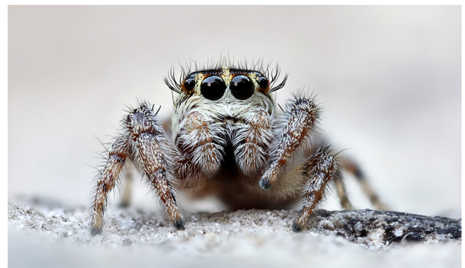
Abb. 10: Das Weibchen des Kanarenspringers ( Macaroeis nidicolens , 4–7 mm) hat schön geschwungene „Wimpern“

Talavera thorelli – Dorn-Ringelbeinspringer: nach der prominenten dornförmigen Embolusspitze des männlichen Pedipalpus.