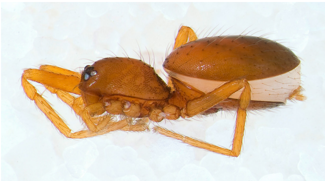
Abb. 9: Das Sandwichspinnchen ( Silhouettella loricatorula , 1,5–2 mm) ist nach ihren Scuta/Schildchen auf der Ober- und Unterseite des Hinterleibes benannt

Silhouettella loricatorula – Sandwichspinnchen: der Hinterleib dieser winzigen Art erinnert an ein Sandwich (Abb. 9).