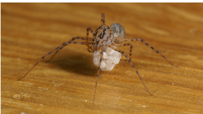
Abb. 12: Weibchen der Gewöhnlichen Speispinne ( Scytodes thoracica , 3–6 mm) tragen ihren Eikokon an den Kieferklauen

Euryopis quinqueguttata – Fünffleck-Ameisenkugelspinne: der wissenschaftliche Artname weist auf fünf Flecken hin,