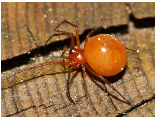
Abb. 6: Nematogmus sanguinolentus (Gallspinnchen, 1,7–2,5 mm) scheint mit dem leuchtend orangen, kugeligen Hinterkörper eine Pflanzengalle nachzuahmen

Nematogmus sanguinolentus – Gallspinnchen: es scheint mit seinem leuchtend orangen, kugeligen Hinterkörper eine Pflanzengalle nachzuahmen