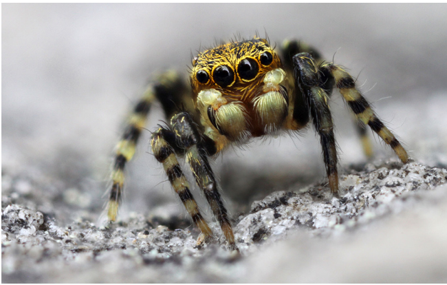
Abb. 11: Das Männchen des Gewöhnlichen Ringelbeinspringers ( Talavera aequipes , 2–3 mm) zeigt deutlich die namensgebende Ringelung der Beine

Fig. 11: The male of Talavera aequipes clearly displays the annulation of the legs that is characteristic for its genus