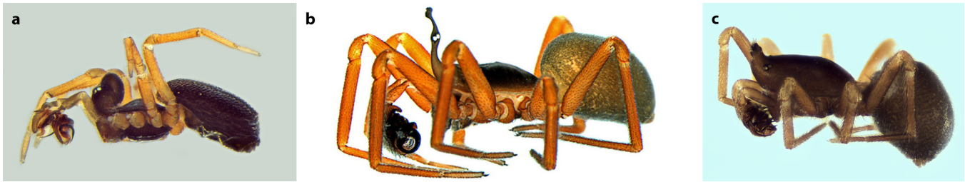
Abb. 3: a. Pelecopsis elongata (Hohes Ballonköpfchen, 1,4–2,5 mm); b. Walckenaeria acuminata (Periskop-Zierköpfchen, 1,8–4,5 mm); c. Savignia frontata (Zapfenköpfchen, 1,5–1,9 mm)

Fig. 3: a. Pelecopsis elongata ; b. Walckenaeria acuminata ; c. Savignia frontata ; three species in which the males show remarkable modifications of the prosoma shape, which have inspired many of the common German names of various groups of linyphiid spiders