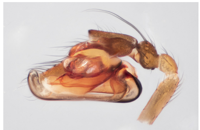
Abb. 4: Diplostyla concolor (Trompetenspinne, 2,5–3 mm); der Pedipalpus des Männchens zeigt in der Seitenansicht die geschwungene Trompetenform besonders schön. Was hier aussieht wie das Rohr eines Blechinstrumentes ist tatsächlich der Embolus des Begattungsorgans, der bei der Paarung zur Spermaübertragung dient

Helophora insignis – Nagelweber: nach der langen, schmalen Form der Epigyne; dieser Name wurde bereits von Menge