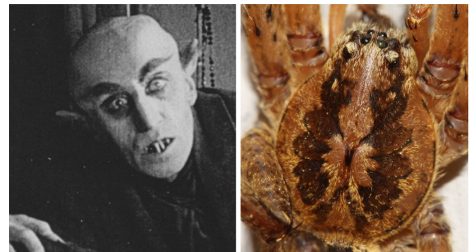
Abb. 13: Vom Prosoma der Nosferatu-Spinne ( Zoropsis spinimana , 10–19 mm) starrt dem kreativen Betrachter die Fratze des namensgebenden Vampirs entgegen

Zoropsis spinimana – Nosferatu-Spinne: fantasievolle Betrachter erkennen in der Zeichnung des Prosomas das Gesicht des namensgebenden Vampirs aus dem Schwarz-Weiß-Filmklassiker „Nosferatu – Eine Symphonie des Grauens“ aus dem Jahr 1922 (Abb. 13).