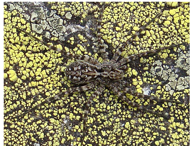
Abb. 7: Der Blockhalden-Stachelwolf ( Acantholycosa norvegica sudetica , 6–9 mm) in seinem Vorzugsbiotop. Die charakteristischen Stacheln auf den Beinen sind vor dem Flechtenhintergrund nur schwer zu sehen

Alopecosa farinosa – Pfingst-Scheintarantel: der Artname ist eine Übernahme aus dem Niederländischen (pinksterpanterspin) und bezieht sich auf den subtilen Unterschied