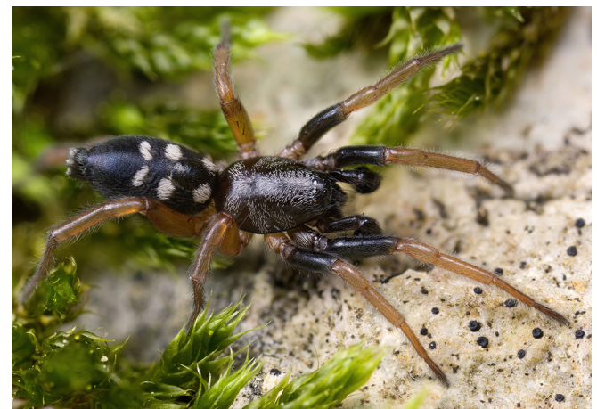
Abb. 2: Der Sechsfleck-Spion ( Phaeoedus braccatus , 4–7 mm) zeigt seine Flecken besonders deutlich

Bei den Männchen vieler Zwergspinnen (Linyphiidae: Eriogoninae) ist die Kopfregion des Prosomas in bizarre Formen modifiziert, die sich erst unter Vergrößerung in ihrer ganzen Komplexität zeigen. Diese artspezifischen Strukturen spielen wohl in vielen Fällen eine Rolle bei der Paarung und waren Anregung für zahlreiche der hier vorgeschlagenen Populärnamen (Abb. 3).