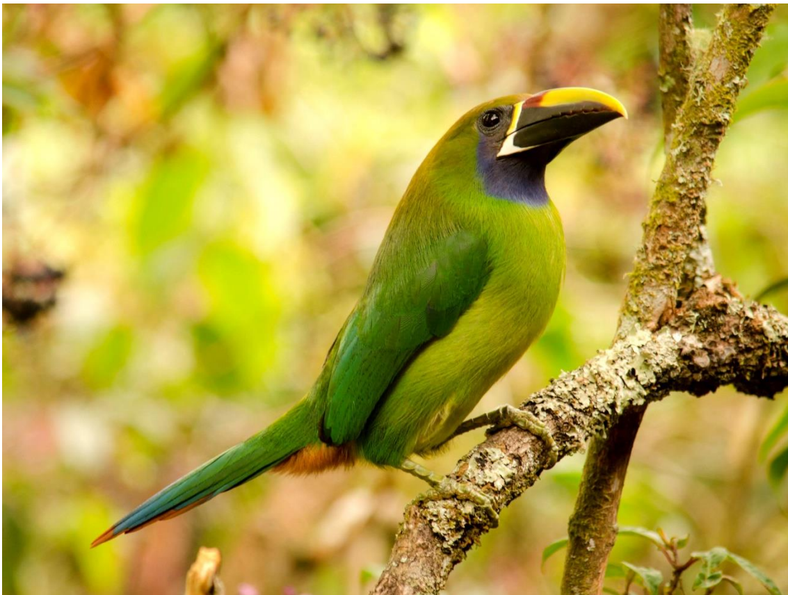
El colorido Tucán esmeralda