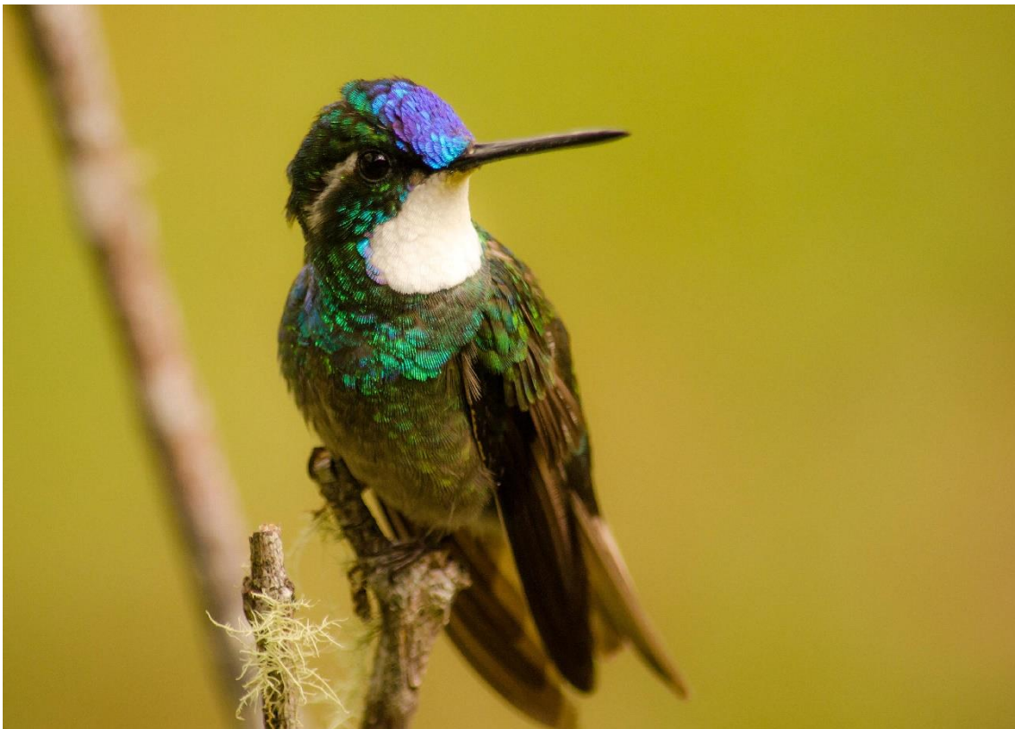
El llamativo Colibrí montañés gorgiblanco

Durante la tarde caminaremos por los senderos buscando más fauna. Además, disfrutaremos de los jardines y las vistas panorámicas. Aquí podemos ver el Pavón norteño (Great Curassow), la Coqueta crestinegra (Black-crested Coquette), el Tangara florida (Emerald Tanager) y los Coati que andan por los jardines. Alojamiento en el Arenal observatory lodge. https://www.arenalobservatorylodge.com/