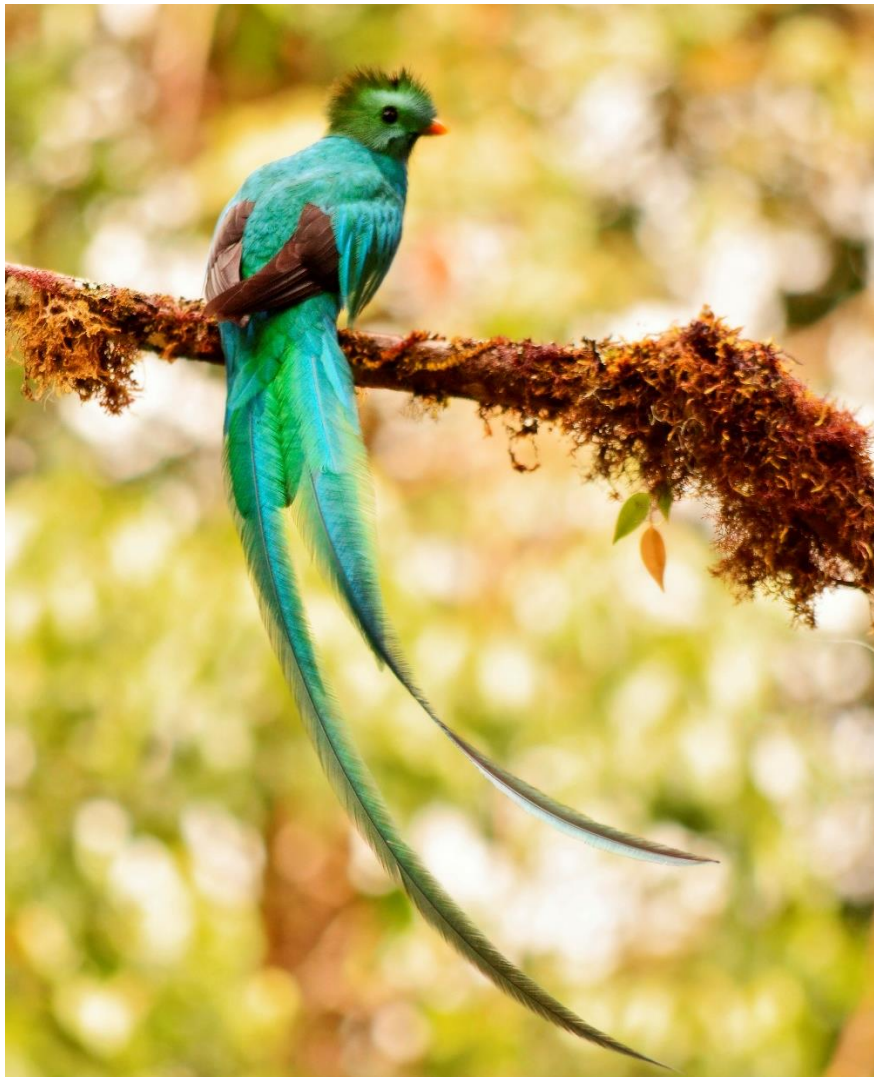
El espectacular Quetzal guatemalteco

Después de comer visitamos los puentes colgantes del Sky Walk. Este sendero discurre por el bosque nuboso con una serie de puentes suspendidos que cruzan el dosel del bosque. Aquí tendremos la oportunidad de buscar otras especies únicas tales como el Cabezón cocora (Prong-billed Barbet), Solitario carinegro (Black-faced Solitaire), Ermitaño negro (Green Hermit), y Tinamú serrano (Highland Tinamou) entre otras muchas especies. Regreso al hotel al final del día. Alojamiento en Cala Lodge http://calalodge.com/