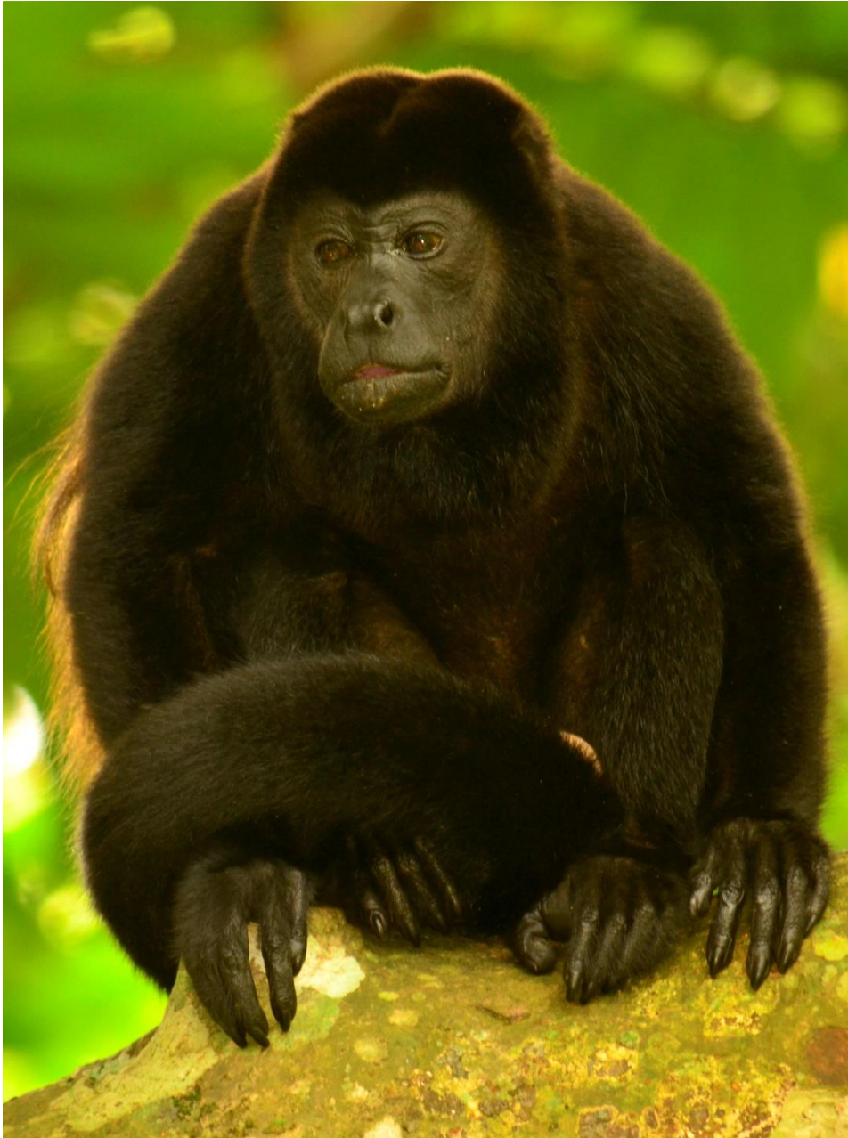
Mono aullador de manto

Posteriormente comenzamos el viaje hacia la parte alta de la cordillera de Tilarán, específicamente la zona de Monteverde, este viaje es de aproximadamente 3 horas. Monteverde se caracteriza por un clima fresco, típico de las montañas con temperaturas entre los 16 y 20 °C. El hotel se encuentra a una altura de 1200 metros s.n.m. En los jardines del hotel es posible encontrar Toquí ojiblanco (White-eared Ground-Sparrow) y Tucanete esmeralda (Northern Emerald Toucanet) entre otros. La cena será en un restaurante local. Alojamiento en Cala Lodge http://calalodge.com/