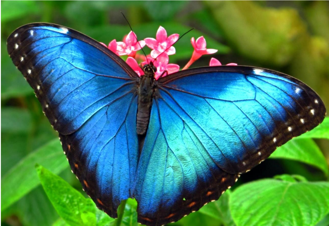
La impresionante mariposa morfo azul

El recorrido por los senderos es de más o menos 2 horas y el terreno es plano con temperaturas cálidas. Después de 1 hora de viaje llegaremos al hotel y continuaremos la observación de aves en el jardín donde podemos encontrar Habia gorgirroja (Red-throated Ant-Tanager), Tangara terciopelo (Scarlet-rumped Tanager) Mielero verde (Green Honeycreeper), Lorito encapuchado (Brown-hooded Tanager) entre otros. Al final de día nos reunimos para la cena en el hotel. Alojamiento en Ara Ambigua Lodge http://www.hotelaraambigua.com/