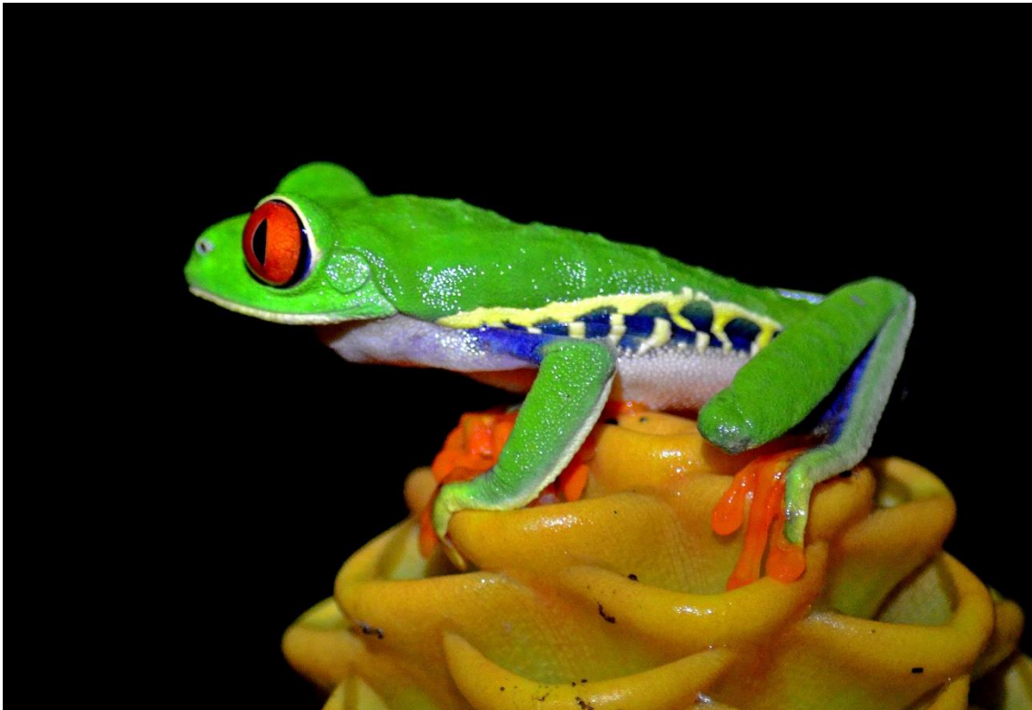
Rana verde de ojos rojos

Esta mañana después del desayuno saldremos a explorar las partes más altas del Cerro de la Muerte, a 3400 metros. En este punto podemos encontrar un verdadero especialista de este hábitat típico del páramo: el Junco volcánico (Volcano Junco). También se puede buscar especies únicas tales como el Colibrí volcánico (Volcano Hummingbird), Cucarachero del bambú (Timberline Wren), Colibrí insigne (Fiery-throated Hummingbird), y el elusivo Yal costarricense (Peg-billed Finch). Después del almuerzo iniciaremos nuestra ruta hacia Alajuela de 3 horas de duración. Esta noche tendremos nuestra cena de despedida en el hotel. Alojamiento en Hotel Buena Vista https://www.hotelbuenavistacr.com/