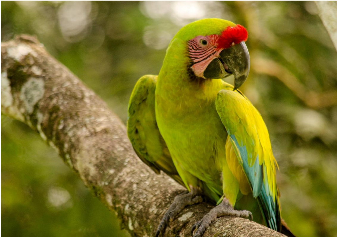
La bonita Guacamaya verde limón

Alojamiento Hotel Cerro Lodge http://hotelcerrolodge.com/