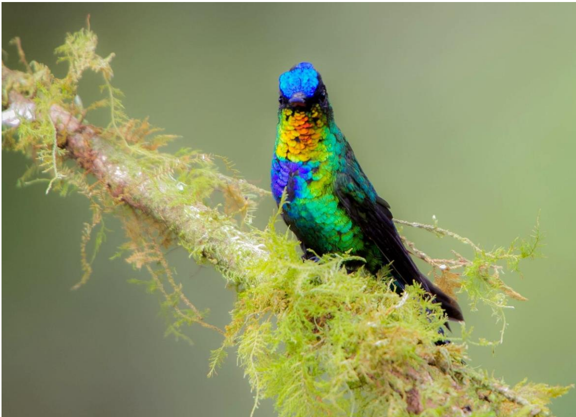
Colibrí insigne: una de las muchas especies de colibrís que buscaremos