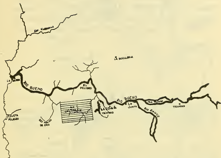
MAPA N° 1