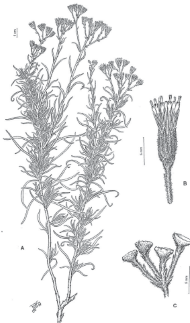
Fig. 2. Senecio caricifolius Hook. et Arn. A. hábito, de Parodi 13655 (BAA). B. capítulo, de Long 513 (BBB). C. receptáculos desnudos, de Long 563 (BBB).

cilíndricos, pubescentes, de ca. 3 mm long.