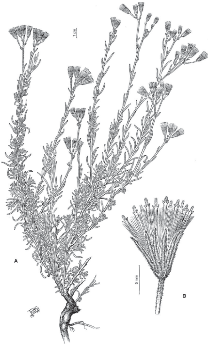
Fig. 3. Senecio leuciscus Phil. A, hábito y B, capítulo, de Medan et al. s. n. (BAA 23598).

C.J.F. Skottsberg 696 ( holotypus , S; imagen digital del holotypus !). Fig. 4. fotografía de una porción del holotipo.