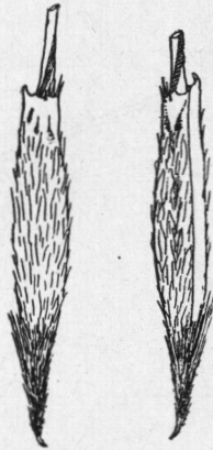
Fig. 4. — Stipa poeppigiana T. et R. var. pubescens Roig nov. var. ( Typus varietatis : G. Dawson 1300). Antecios, \times 5

Observación II: La pilosidad de las cañas se va perdiendo hasta quedar glabras cuando son viejas, aunque sí se mantienen los pelos hirsutos y reflejos por debajo de los nudos.