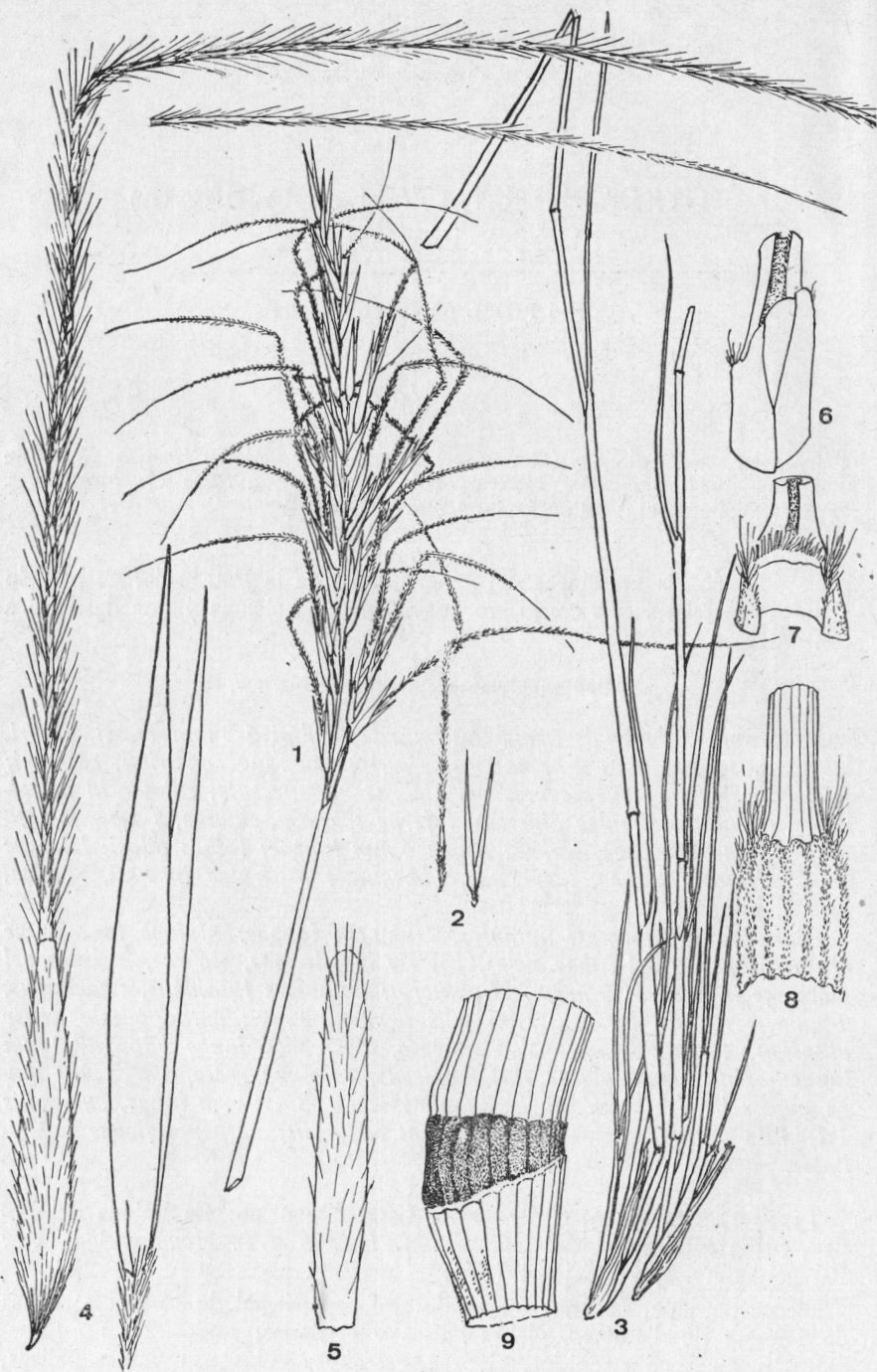
Fig. 1. — Stipa subplumosa Hicken nov. sp. ( Typus speciei : Iter Patagonicum 28): 1, panícula, \times 0,5 ; 2, antecio y glumas, \times 1 ; 3, macollos, \times 0,5 ; 4, antecio y glumas, \times 5 ; 5, pálea, \times 5 ; 6-7, ligulas superior y basal respectivamente, \times 5 ; 8, dorso de la articulación de la vaina con la lámina, \times 5 ; 9, nudo, \times 10 .