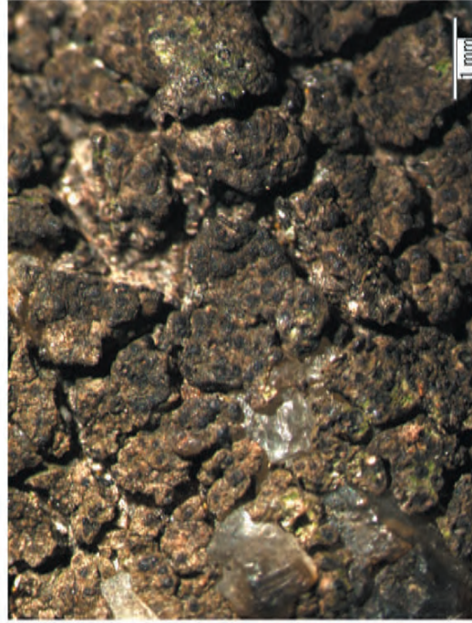
Obr. 3. Perithécia lišejníku Verrucaria ochrostoma jsou zanořena v hnědé stéle. Fig. 3. Perithecia of the lichen Verrucaria ochrostoma are immersed in a brown thallus.