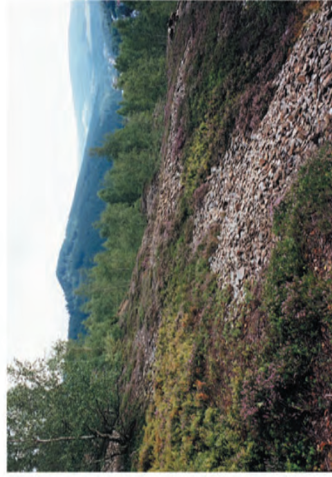
Obr. 2. Na JIZ svahu vrchu Tisovec se nachází měďná výsypka, kde roste Rhizocarpon ridescens . Fig. 2. Rhizocarpon ridescens grows on a copper-mine pit heap on the SSW slope of Tisovec hill.