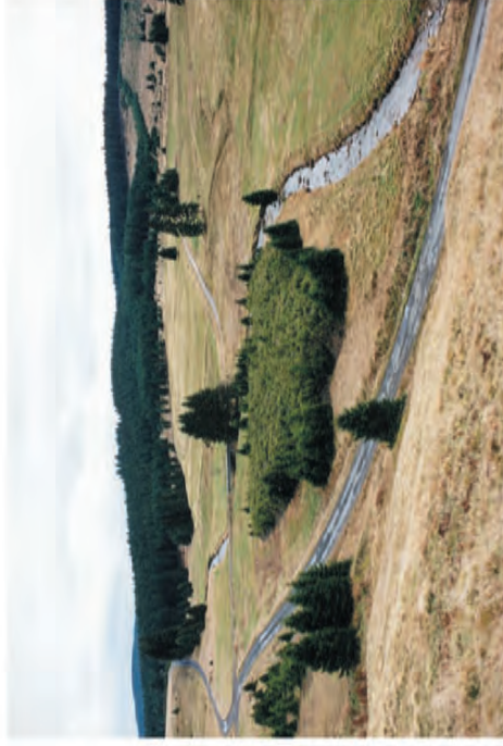
Obr. 5. V údolí potoka Černá se nachází uranová výsypka s výskytem řady ferrofilních lišejníků, např. Acarospora sinopica , Lecanora handlíři , L. subaurea , Lecidea silacea .