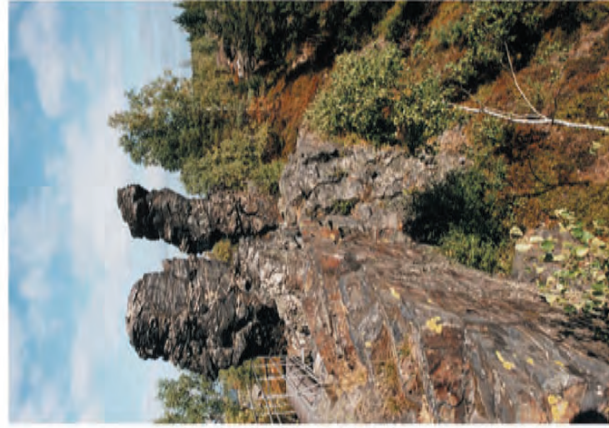
Obr. 4. Na kvarcitovém skalním výchozu PP Vysoký kámen, v místě obohaceném vápníkem díky lidské činnosti, se vyskytuje Verrucaria ochrostoma .