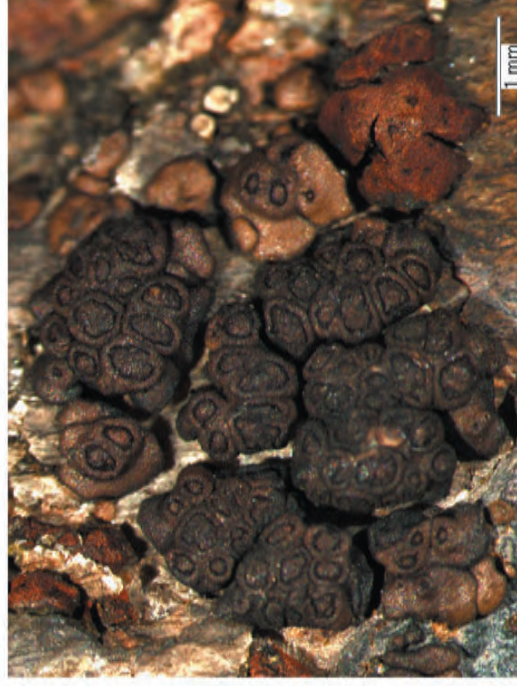
Obr. 6. Acarospora rugulosa (hnědá) a A. sinopica (rezavě červená). Fig. 6. Acarospora rugulosa (brown) and A. sinopica (rusty red).