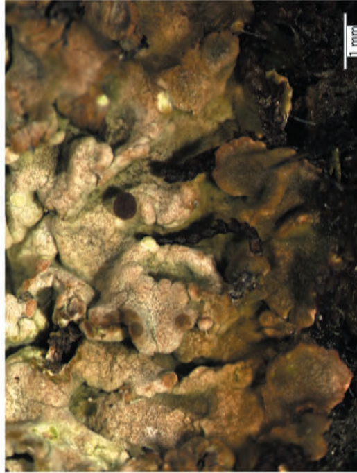
Obr. 7. Baeomyces placophyllus vytváří lalůčky na okraji stélky, čímž se liší od B. rufus . Fig. 7. Baeomyces placophyllus forms lobules on the thallus margins, distinguishing it from the B. rufus .