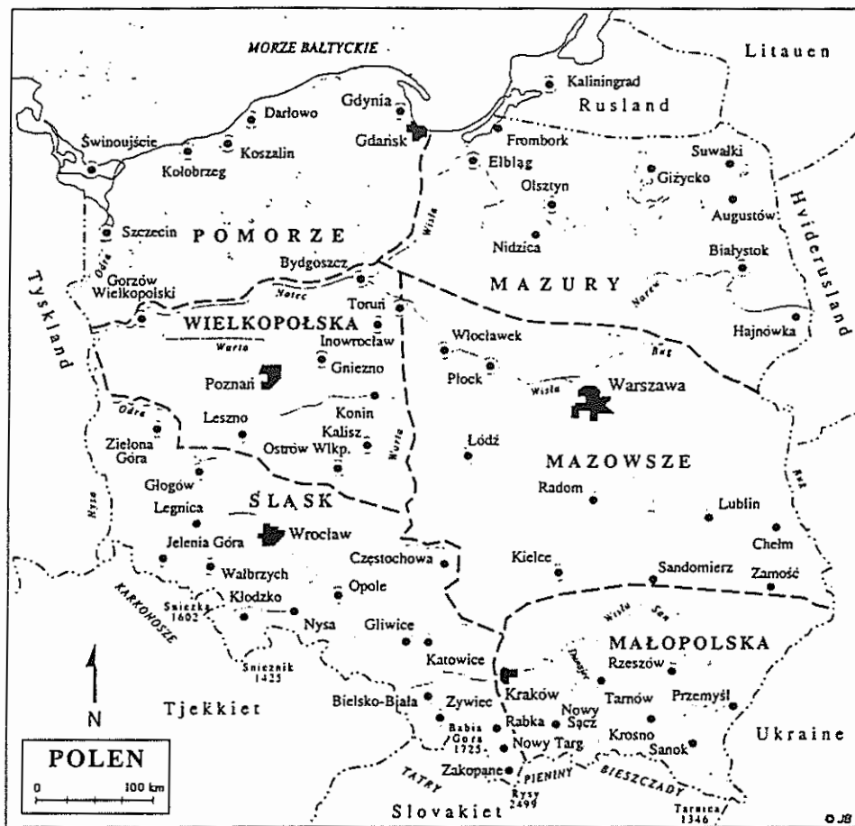
Polens seks regioner.

Efter Bent Gynter: Polen, en Skarv-guide.