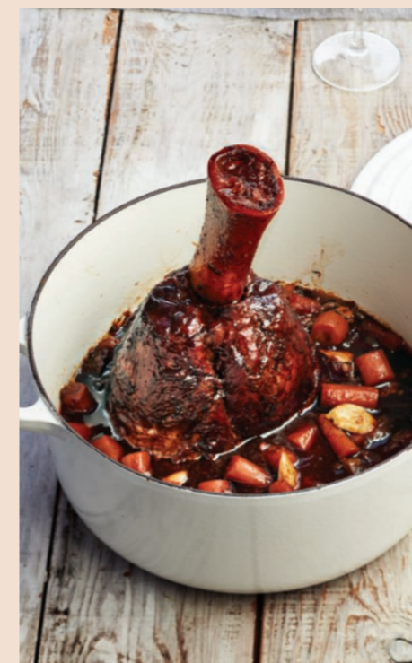
JARRET DE VEAU BRAISÉ