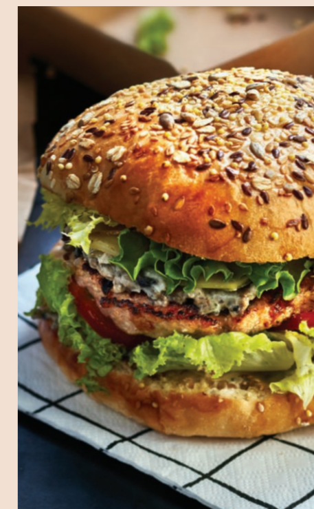
BURGER DE VEAU ORLOFF