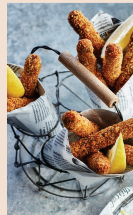
FINGER DE VEAU VIENNOIS