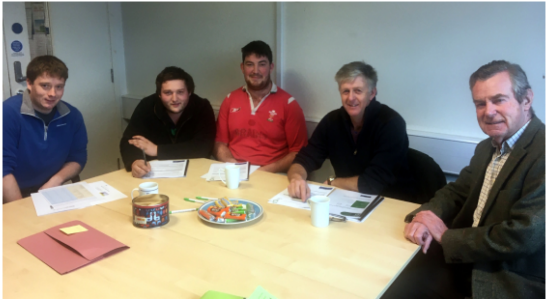
Cyfarfod grŵp o ffermwyr i drafod profion pridd ar eu ffermydd. Swyddfa FWAG Cymru, Dolgellau

B u'n dymor andros o brysur i ddim FWAG Cymru wrth i ni geisio sicrhau ein bod yn profi pridd ac ysgrifennu Cynllun Rheoli Maethynnau i'n haelodau sydd yn awyddus i dderbyn y gwasanaeth hwn. Mae'r cynllun yn werthfawr wrth i ffermwyr fynd ati i drefnu pa faethynnau, yn cynnwys calch, gwrtait, tail ac yn y blaen mae pob cae yn ei dderbyn. Drwy roi yr union faethynnau mae'r caeau a'r cnydau, yn cynnwys glaswellt, eu hangen, mae'r ffermwyr yn gallu sicrhau nad ydynt yn gwastraffu gwrtait ac yn y blaen, ac yn lleihau unrhyw bosibilrwydd gollwng maethynnau i nentydd ac afonydd, er mwyn cadw ansawdd dŵr da.