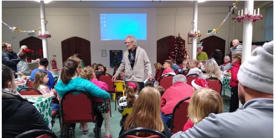
Dathliad Nadolig Llan Llanast capel Deer Park, Rhagfyr 2023

'Fe gawson ni sgwrs gyda Foursquare Missions am ein hawydd i fynd i'r maes cenhadol,' eglurodd Jonathan. 'Fe ofynnion nhw, "Ydych chi erioed wedi ystyried gweinidogaethu mewn eglwys