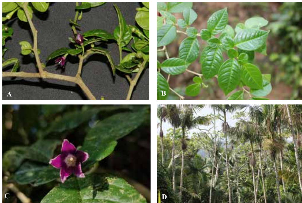
A. Rama con flores y fruto inmaduro. B. Rama de un arbusto de Cuatresia albertovelozii creciendo en un sitio abierto y soleado. (F. Jiménez & A. Veloz 3458 JBSD). C. Flor abierta. D. Bosque de manacla, Prestoea montana var. acuminata , ambiente típico donde crece C. albertovelozii , El Manaclar de Monte Grande, San José de Ocoa.

con abundancia de Prestoea montana , 18° 27.5' N, 70° 21' Oe, elev. 1400 – 1600 m, 24 febrero 1993. (fl), F. Jiménez & T. Zanoni 817 (JBSD); Loma Barbacoa, subida por la ladera SE desde El Cañaveral, bosque de Magnolia domingensis , 18° 28' N, 70° 20.5' Oe, elev. 1400 – 1700 m, 17 marzo, 1993. (fl), F. Jiménez & T. Zanoni 866 (JBSD); Loma Barbacoa, subida por la ladera Norte desde la presa de Aguacate, bosque nublado con Prestoea montana y Magnolia domingensis , 18° 27' 31.4'' N, 70° 20' 20.4'' Oete, elev. 1540 m, 23 abril, 2018. (fl), Y. Piña & et al 362 (JBSD). Provincia San José de Ocoa [antes, Peravía]: Loma El Rancho, bosque húmedo y latifoliado con palma manacla [ Prestoea montana ], 18° 29' N, 70° 27' Oe, elev. 1300 – 1400 m, 19 agosto 1987. (fl), J. Pimentel & R. García 778 (JBSD). El Manaclar de Monte Grande, bosque ribereño de Prestoea montana , en las márgenes de un arroyo, 18° 31' N, 70° 27' Oeste, elev. 1200 m, 4 abril 2002 (fl), F. Jiménez & A. Veloz 3458 (JBSD). Provincia San Cristóbal: ladera S de Loma Humeadora, transición del manaclar a bosque latifoliado nublado, 18° 38' N, 70° 15.5' Oeste, elev. 1050 m, 9 marzo, 1994 (fl), F. Jiménez, A. Veloz & D. Polanco 1197 (JBSD).