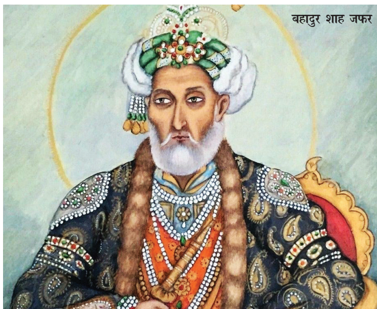
बहादुर शाह जफर

को मंगल की फाँसी की खबर मेरठ मुख्यालय पर पहुँचते ही तब बहादुरशाह के नेतृत्व में रात्रि को ही विप्लव की लपटों में समूचे मेरठ क्षेत्र का ब्रिटिश साम्राज्य जल उठा, देशी सैनिकों एवं वहाँ की जनता ने अंग्रेजों के बाँगलों में आग लगा दी।