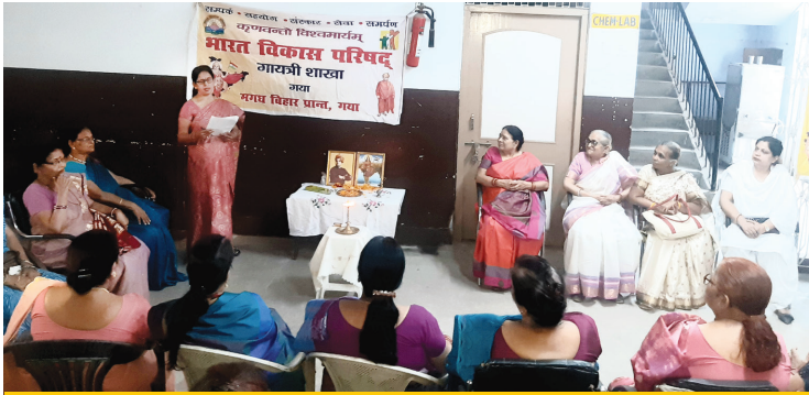
शाखा द्वारा परिवार में महिलाओं की कानूनी अधिकार की जानकारी दी गई