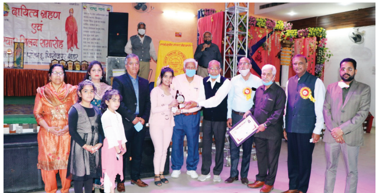
शाखा द्वारा अपने सदस्यों के 'परिवार मिलन' का आयोजन किया गया

Chandrasekharpur, Bhubaneswar, Odisha East : Branch distributed Grocery materials etc were provided to the inmates of Sri Maa Ananda Ashram, Damana on 14 February