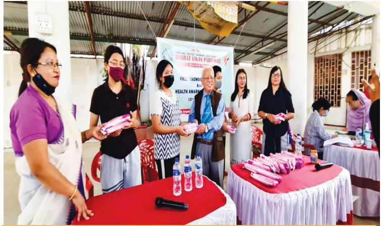
मणिपुर प्रांत ने 'अनीमिया मुक्त भारत' का आयोजन किया गया

रामकृष्ण कानपुर : शाखा द्वारा स्थानीय जय भगवान गेस्ट हाउस नवीन नगर काकादेव में कानपुर मेडिकल कॉलेज चिकित्सकों की टीम की देखरेख में स्वैच्छिक रक्तदान शिविर का आयोजन किया गया जिसमें 23 लोगों द्वारा रक्तदान किया गया। शाखा द्वारा सभी रक्तदाताओं