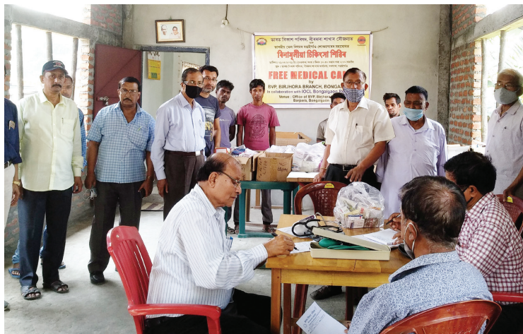
स्कूल की छात्रों के लिए एनीमिया के लिए शिविर में रक्त परीक्षण किया गया

anemic who were provided medicines for one month. Medicines distributed to these