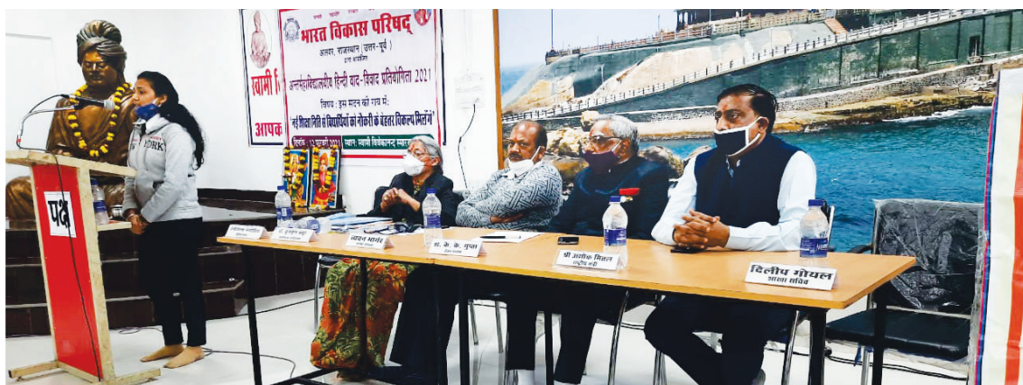
शाखा द्वारा अन्तर्महाविद्यालयीय हिन्दी वाद-विवाद प्रतियोगिता का आयोजन किया