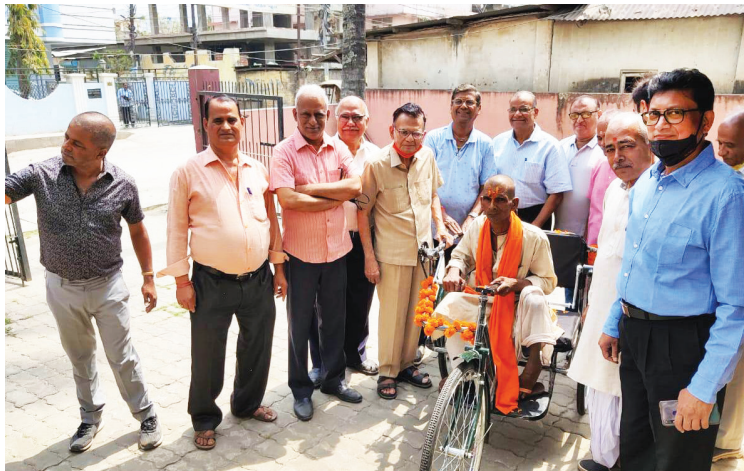
मध्य गुवाहाटी शाखा ने सदस्यों की उपस्थिति में ट्राइसाइकिल दिया