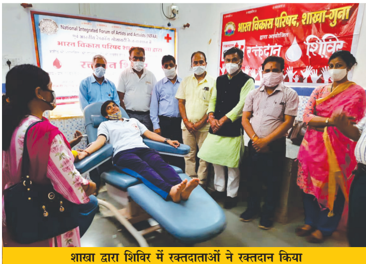
शाखा द्वारा शिविर में रक्तदाताओं ने रक्तदान किया

के प्रति आभार व्यक्त किया गया। इस अवसर पर शाखा सदस्यों सहित अन्य गणमान्य सदस्य उपस्थित रहे।