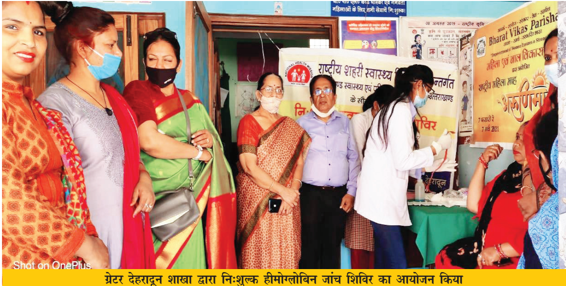
ग्रेटर देहरादून शाखा द्वारा निःशुल्क हीमोग्लोबिन जांच शिविर का आयोजन किया

मानक सिद्ध देहरादून, उत्तराखण्ड पश्चिम : शाखा द्वारा महिला एवं बाल विकास प्रकल्प में महिला माह के अन्तर्गत एनीमिया मुक्त भारत अभियान में हीमोग्लोबिन जांच की गई जिसमें 27 महिलाओं की हीमोग्लोबिन की जांच