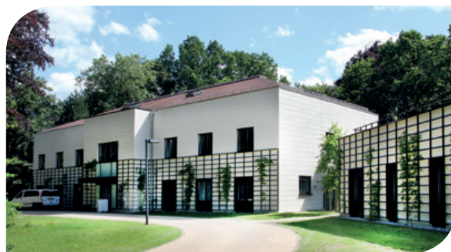
Zeitgleiche Ausstrahlung im kooperierten Programm von rbb und MDR.

Das Sprechen über den Tod wird in unserer Gesellschaft weitgehend tabuisiert, umso mehr, wenn es sich um den Tod eines Kindes handelt. Das Kinderhospiz „Bärenherz“ in Markkleeberg bei Leipzig ist ein Ort, der das Sterben nicht verdrängt. Doch viele Kinder kommen nicht zum Sterben ins Hospiz, sondern sie verbringen hier mit ihren Eltern eine Entlastungszeit. Geschwisterkinder geben sich in der Heldengruppe gegenseitig Halt und Väter können beim Vätertreff reden – oder auch mal schweigen. Das „Bärenherz“ ist ein Ort zum Lachen, Reden und Weinen.