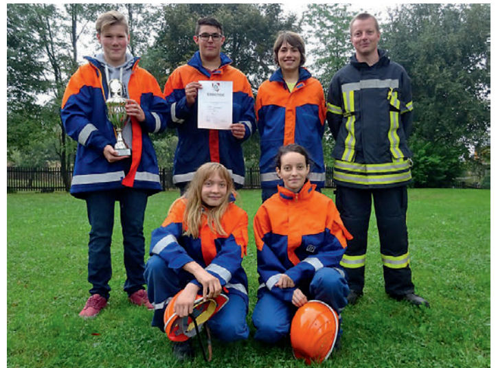
Siegermannschaft des Wanderpokals des Bürgermeisters

Während der ganzen Veranstaltung gab es neben den Wettkämpfen ein schönes Programm für alle Gäste und Teilnehmer. Natürlich wurde Kaffee ausgeschenkt und dazu selbstgebackener Kuchen verkauft. Es gab selbstverständlich auch Herzhaftes, alkoholfreie Getränke, aber auch ein frisches Bier. So war es ein frohes Beieinander als die Siegerehrung stattfand. Es feierten alle Teilnehmer und Gäste ausgiebig bei einer tollen Party.