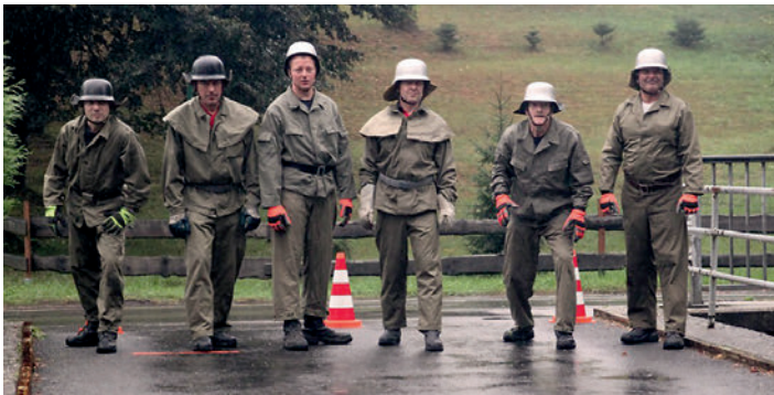
Kameraden des Feuerwehrvereines Langenberg-Meinsdorf

Egal, alle Aktiven Kameraden und die Jugendfeuerwehr trafen sich vor Mittag zum Vorbereiten und zum Aufbau, denn es sollte nicht nur gefeiert werden, sondern auch einen Wettkampf im Löschangriff aller ortsansässigen Wehren und Feuerwehrvereine um den begehrten Wanderpokal des Bürgermeisters geben.