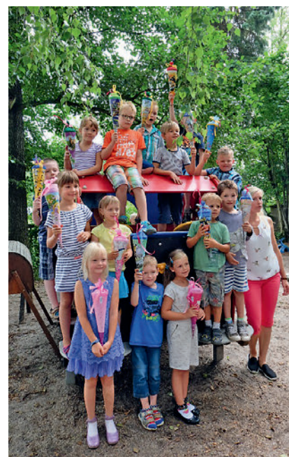
Der Elternrat des Kindergartens