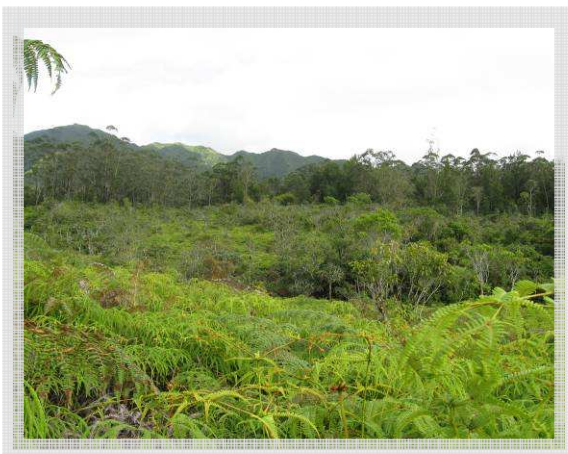
▲ La Fougeraie