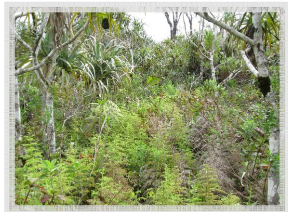
▲ La Pandanaie, faciès à Lycopodiella cernua