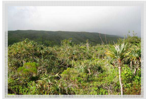
▲ Vue générale de la Pandanaie de la Plaine des Palmistes : une mosaïque d'habitats très diversifiés