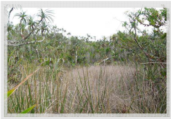
▲ La Pandanaie, faciès à Juncus effusus