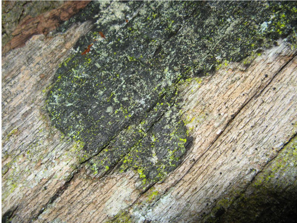
Fig. 5 - Colonisation des lichens sur les bois carbonisés.