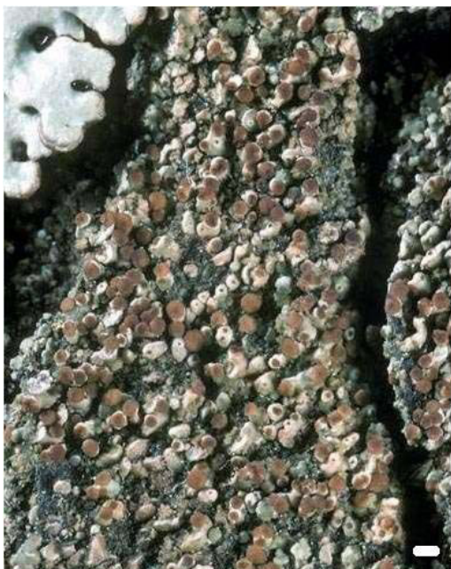
Fig. 1 - Carbonicola anthracophila (échelle 1 cm).