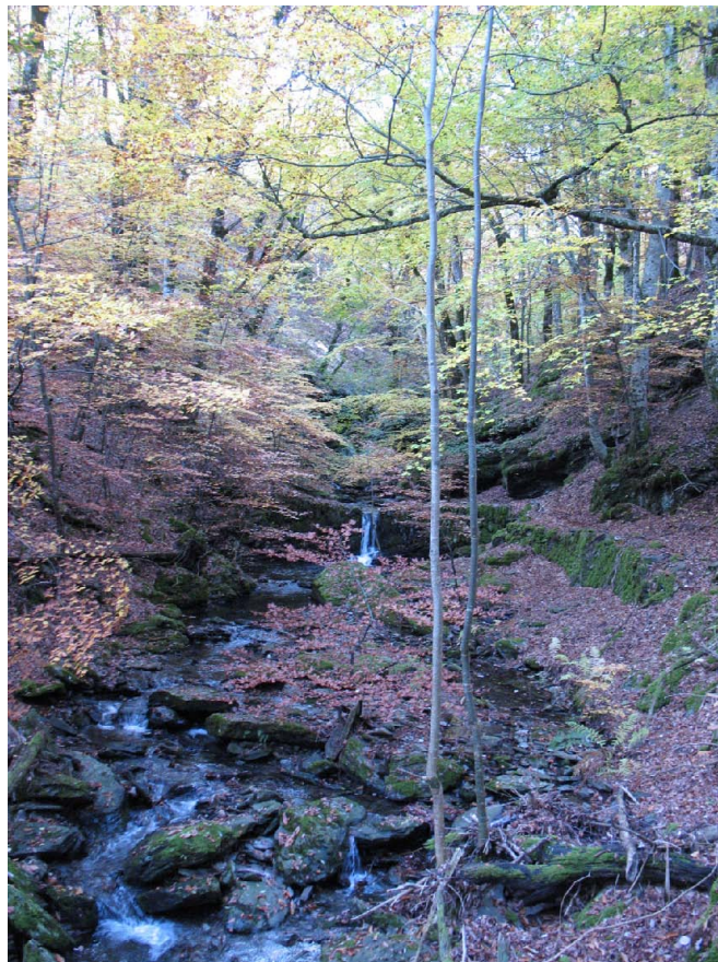
Fig. 6 - Milieu forestier des deux stations cévenoles.