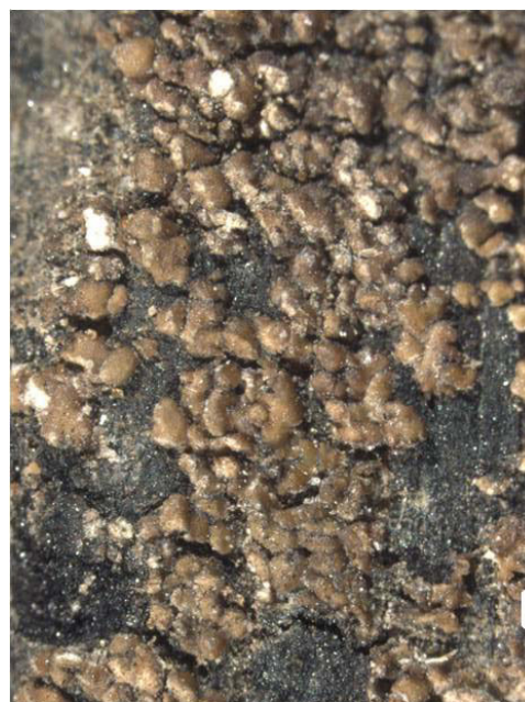
Fig. 2 - Carbonicola myrmecina (photo de Elena Pittao, échelle 1 cm).

biogéographique subméditerranéen languedocien (Default, 2011), sous ombroclimat subhumide et sous continentalité thermique subocéanique. Les mois de mai et octobre sont les mois les plus pluvieux, le mois de juillet est le mois le plus sec sans période de sécheresse estivale. La station de Puychauzier est à une altitude de 700 m d'altitude et celle d'Aubuisson à environ 600 m. La protection des fortes dessiccations en milieu forestier accentue certainement les conditions climatiques locales des deux stations et en particulier l'humidité atmosphérique.