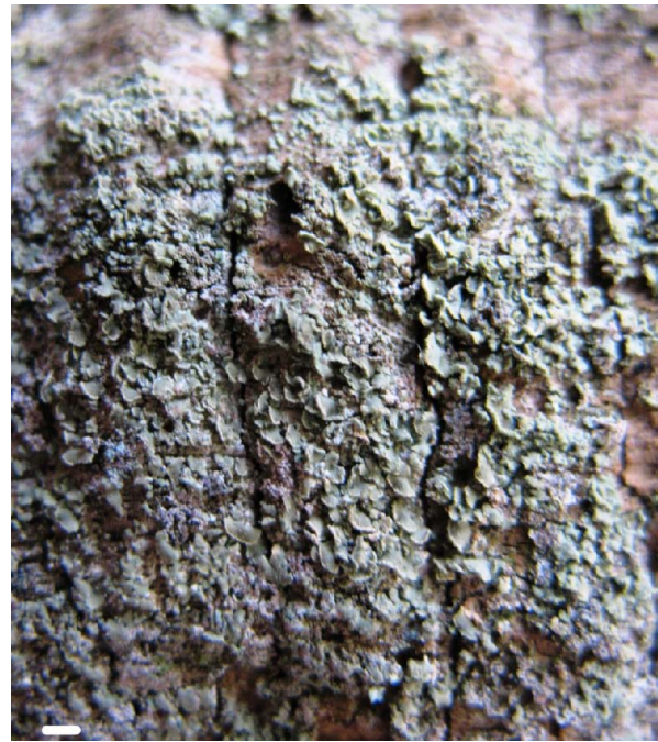
Fig. 4 - Hypocenomyce scalaris (échelle 1 cm).

La fig. 8 précise toutes les espèces récoltées lors des prospections. Dans le tableau sont indiquées dans la colonne écol. la position du taxon par