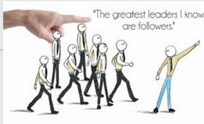
Leiers en volgelinge