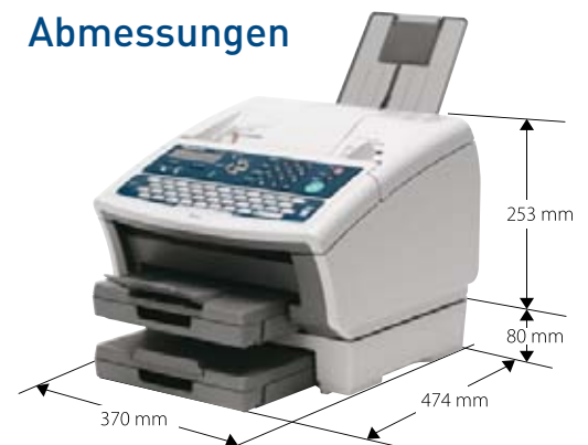
(Abb. UF-6300 mit optionaler 2. Papierkassette)