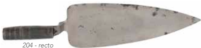
204 - recto