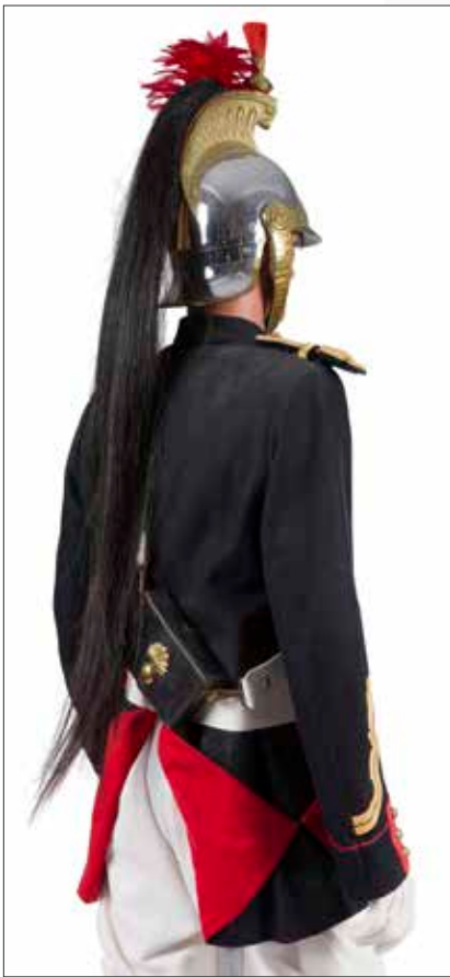
274 - vue de dos