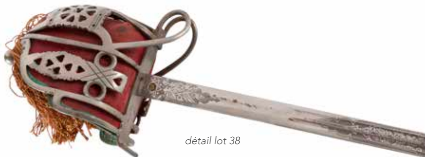
détail lot 38