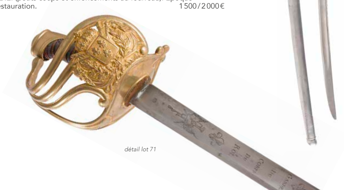
détail lot 71