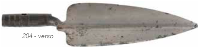
204 - verso

204 U.S.A. BAÏONNETTE-TRUELLE MODÈLE 1873 POUR FUSIL ET CARABINE SPRINGFIELD MODÈLE 1873. La poignée est marquée « PAT.APR 16 M 72 ». Le mécanisme de verrouillage est placé à l'intérieur de la douille dont une partie pivote sur elle-même. Lame large avec arête médiane. Pas de fourreau ni poignée de bois amovible Lt: 370mm - Ll: 280mm - Il: 87,7mm - Ld: 89,6mm - Dd: 18/19mm A.B.E. Reste de bronzage. 200/250€