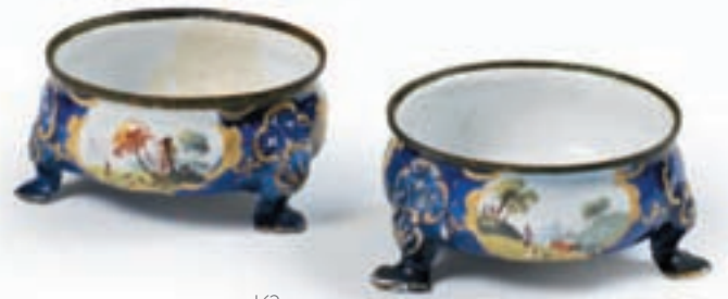
162 PAIRE DE PETITS PRÉSENTOIRS de forme ronde en émail de Battersea. Ils sont ornés dans des réserves de paysages animés sur fond gros bleu et bordures dorées. Fin XVIII ème ou début du XIX ème siècle. (Restaurations). H : 3,5 cm. L : 7,5 cm