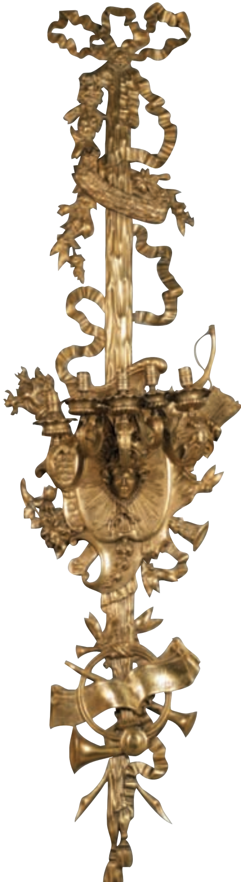
216 PAIRE D'IMPORTANTES APPLIQUES à cinq bras de lumière en bronze ciselé et doré de masques, instruments de musique, torche, arc et carquois, draperies, guirlandes et nœuds de ruban. Style du XVIII ème siècle. H : 225 cm. L : 60 cm