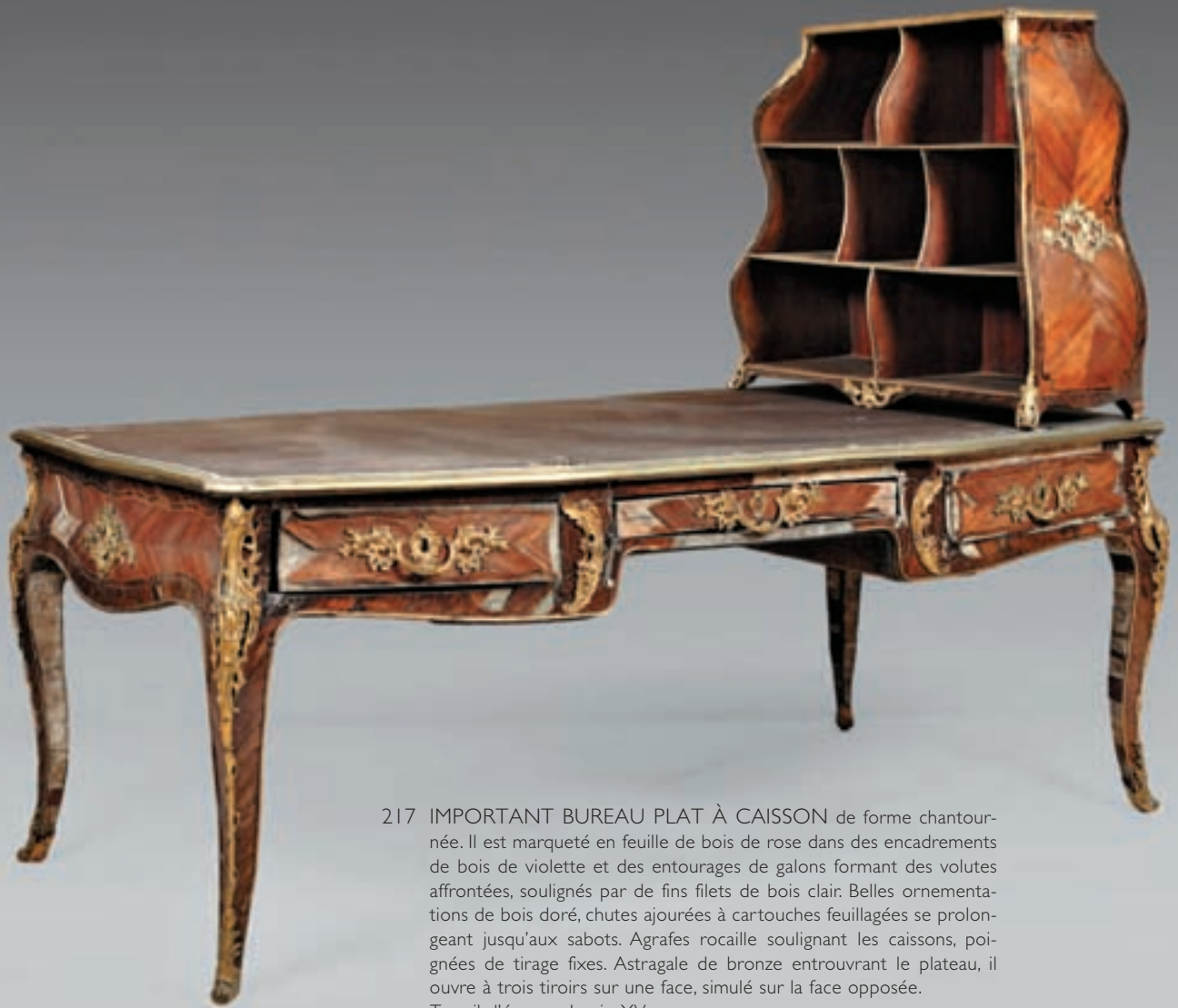
217 IMPORTANT BUREAU PLAT À CAISSON de forme chantournée. Il est marqueté en feuille de bois de rose dans des encadrements de bois de violette et des entourages de galons formant des volutes affrontées, soulignés par de fins filets de bois clair. Belles ornements de bois doré, chutes ajourées à cartouches feuillagées se prolongeant jusqu'aux sabots. Agrafes rocaille soulignant les caissons, poignées de tirage fixes. Astragale de bronze entrouvrant le plateau, il ouvre à trois tiroirs sur une face, simulé sur la face opposée. Travail d'époque Louis XV. Très mauvais état. H : 78 cm. L : 194 cm. P : 97 cm