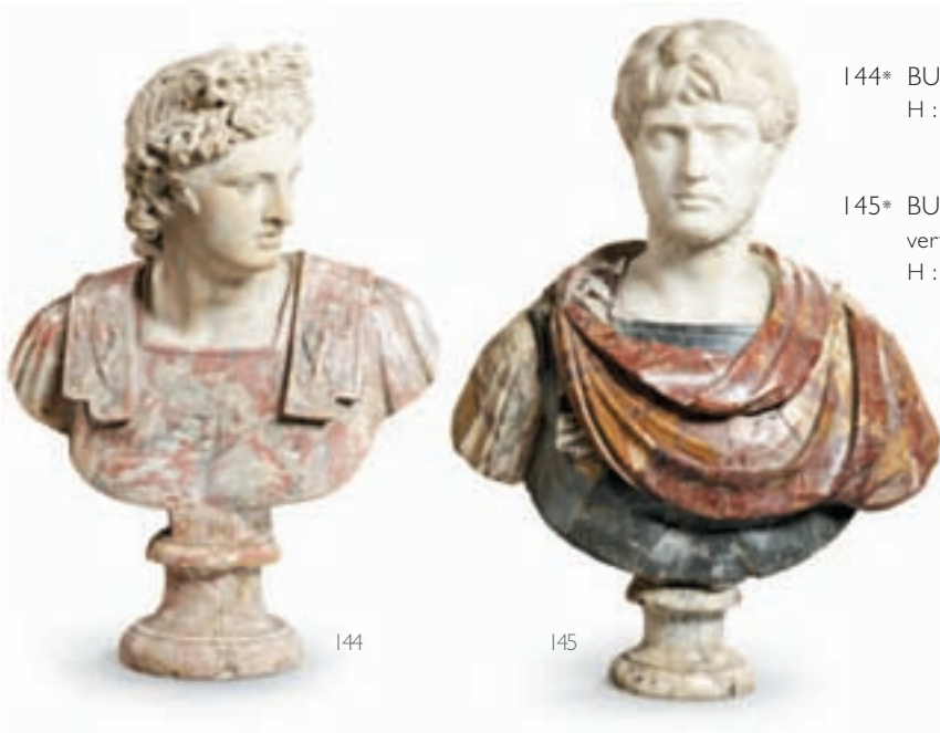
144* BUSTE de l'Apollon du Belvédère H : 89 cm