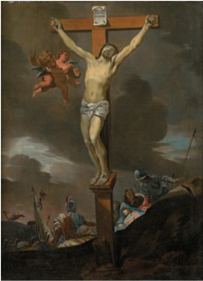
9 Ecole FRANCAISE du XVII ème siècle, suiveur de Lubin BAUGIN La Crucifixion Toile 68,5 x 50 cm