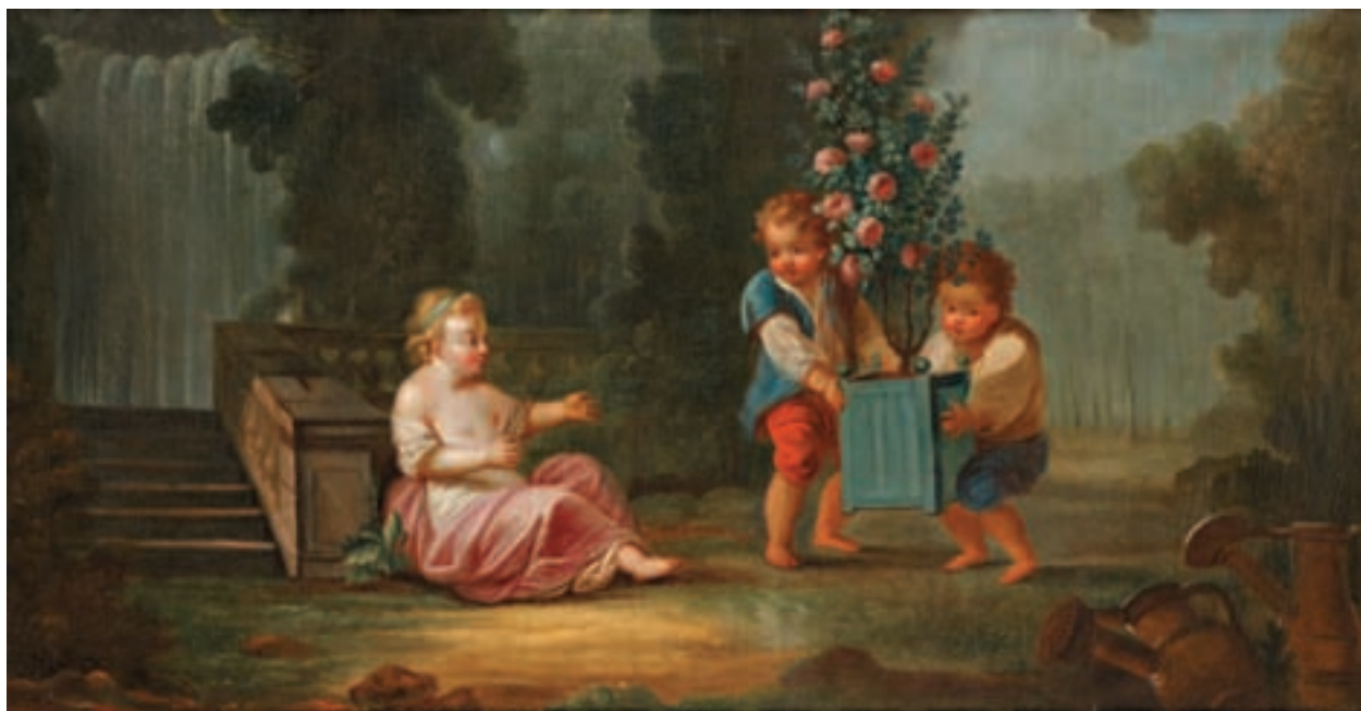
48 HUET Jean Baptiste Les enfants jardiniers Paire de toiles 71 x 136 cm