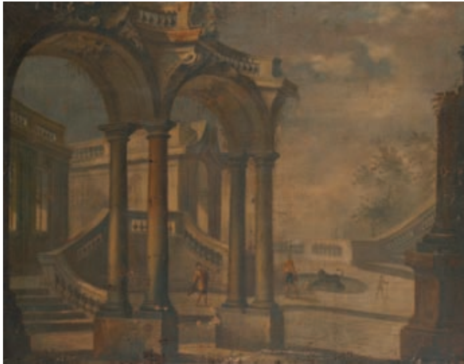
45 Ecole FRANCAISE vers 1700, entourage de Jacques LAJOUE Caprices architecturaux Paire de toiles, sur leur toile d'origine 86,5 x 110,5 cm (Manques et usures)