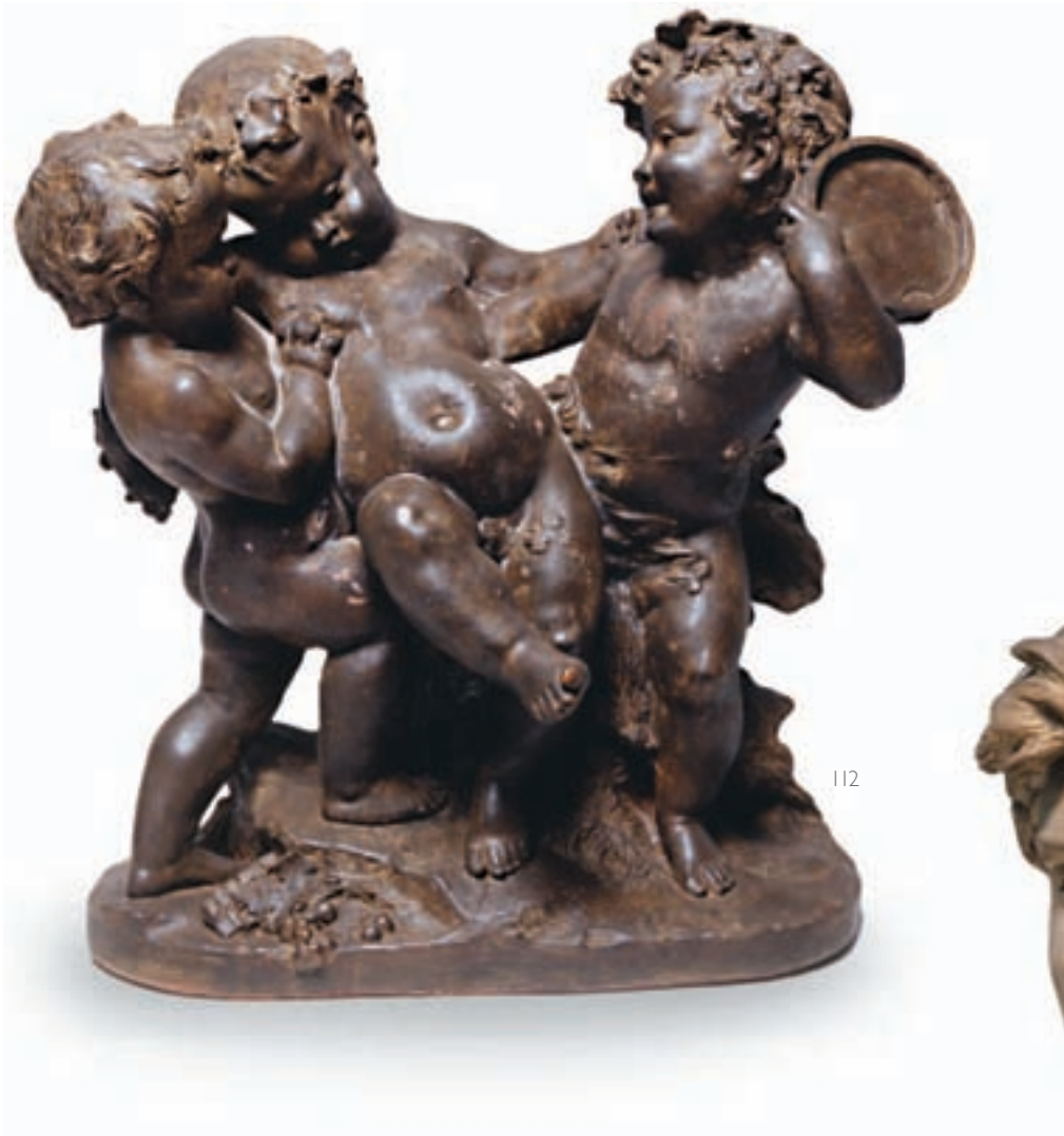
112 GROUPE EN TERRE CUITE de trois enfants bacchants, deux d'entre eux soutenant le troisième. Base ovale. XIX ème siècle. H : 55 cm. L : 55 cm