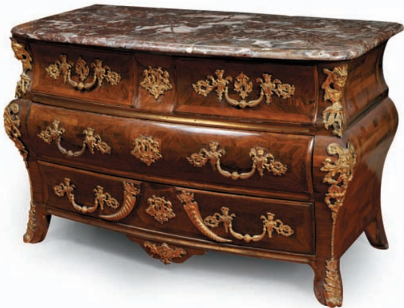
252 COMMODE tombeau en placage de palissandre ouvrant à trois rangs de tiroirs dont deux tiroirs en ceinture, reposant sur des pieds gousset, riche garniture de bronzes dorés à la Bérain, dessus de marbre rouge veiné de blanc Epoque Régence H : 83,5. L : 129 cm. P : 95,5 cm