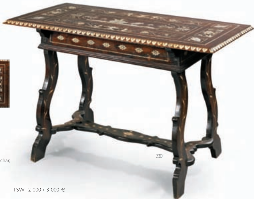
230* TABLE PLATEAU en marqueterie Incrustations d'ivoire sculpté décors de char, de grotesque et vase. Epoque XVIII ème siècle H : 78 cm. L : 122 cm. P : 63 cm