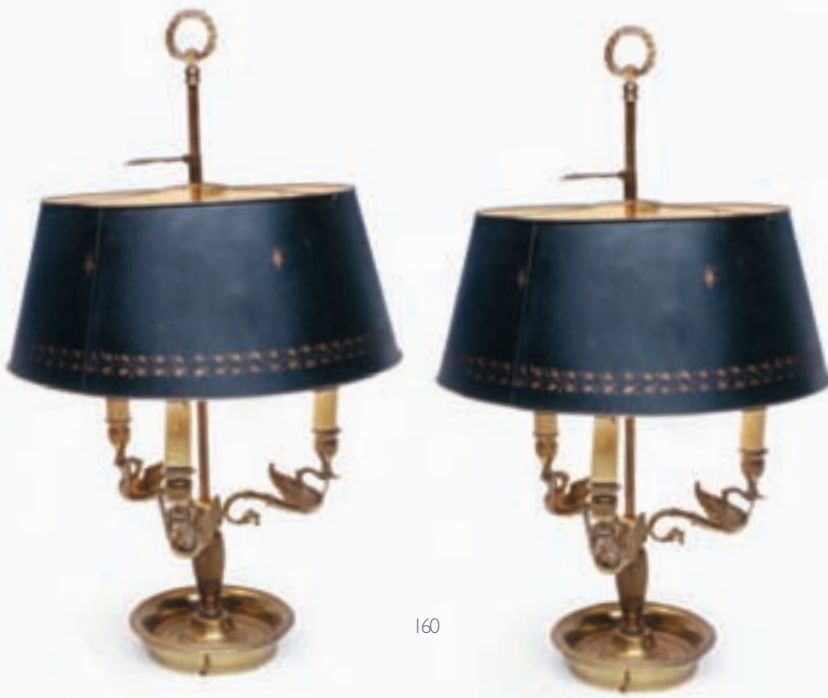
160 PAIRE DE LAMPES BOUILLLOTTE en bronze doré à trois bras de lumière en forme de cygne, base à décor de croisillons et palmettes, prise de main en couronne de laurier, abat-jour en tôle verte à décor de feuilles de laurier. Style Empire H : 63 cm