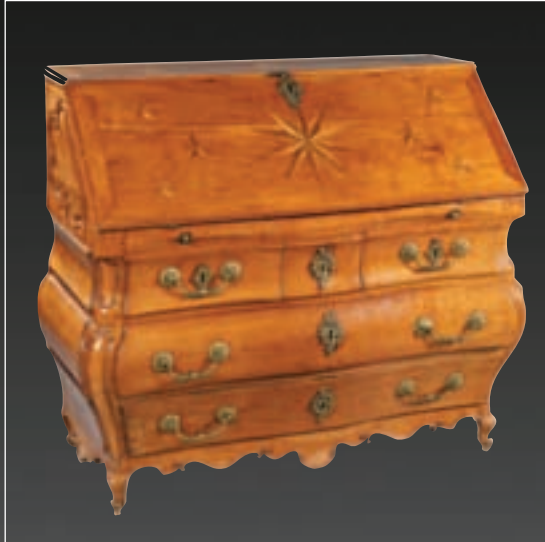
247 COMMODE scriban de forme mouvementée en meurisier mouluré ouvrant à quatre tiroirs. Abattant à sept étoiles en marqueterie, découvrant six tiroirs, une porte et dix casiers, la ceinture inférieure moulurée. Quatre pieds coquille. Sud-Ouest. Epoque Louis XV. 110 x 62 x 120 cm