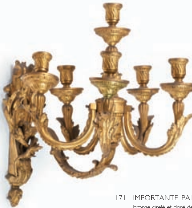
171 IMPORTANTE PAIRE D'APPLIQUES à six bras de lumière en bronze ciselé et doré de feuilles d'acanthé, tors de canaux, et enroulements. Les culots en forme de grenades. Style Louis XVI