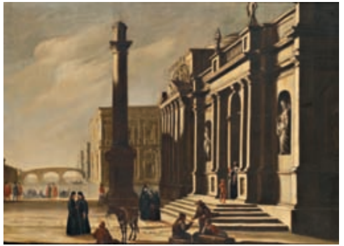
43* Attribué à Antonio VISENTINI (1688 - 1782) Personnages devant des palais Paire de toiles 72 x 99 cm (certains personnages ont été rajoutés postérieurement) RM 5 000 / 6 000 €