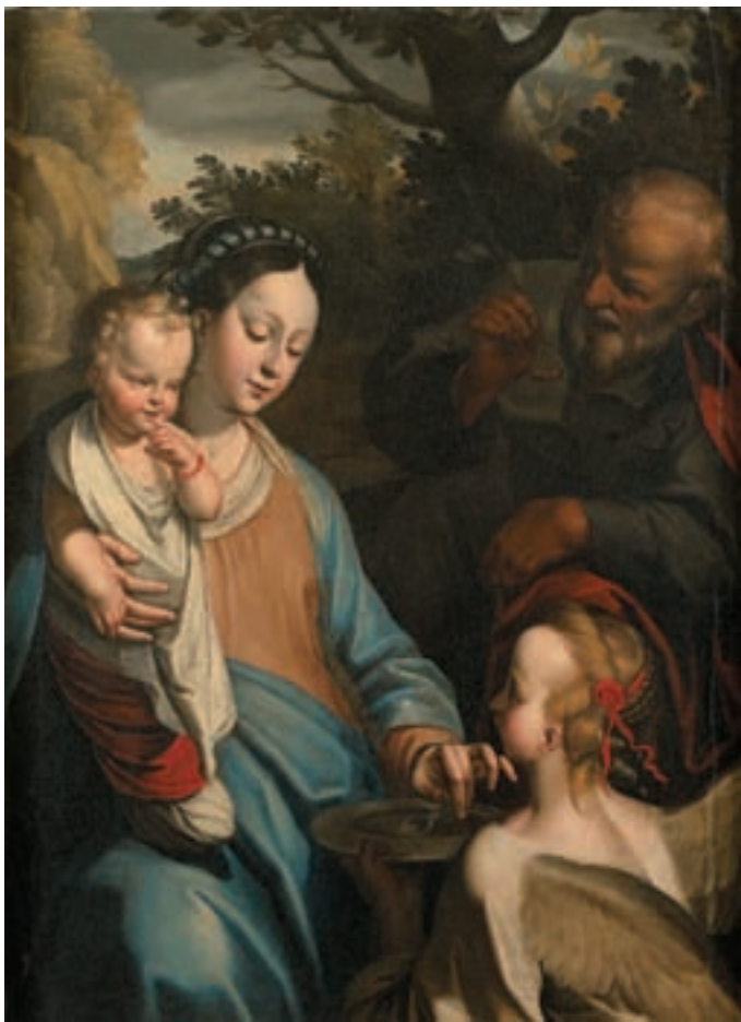
6 Ecole ITALIENNE du XVII ème siècle, d'après Francesco VANNI Le repos pendant la fuite en Egypte Toile 84,5 x 69 cm

Reprise de la gravure d'après un modèle de Francesco Vanni sur le marché de l'art à Londres en 1987. Une autre version dans le même sens que notre tableau est conservée au Louvre (voir Le catalogue sommaire illustré des peintures du musée du Louvre, Paris, 1981, reproduit, p. 249.