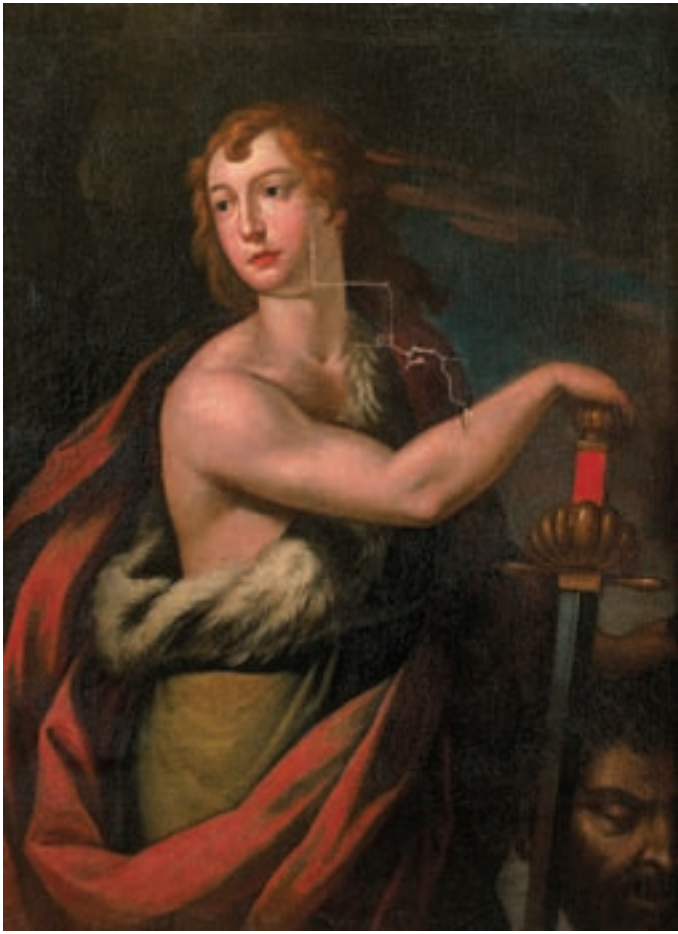
14 Ecole FRANCAISE du XVII ème siècle, entourage de Nicolas REGNIER David portant la tête de Goliath Toile 108 x 90 cm Accidents