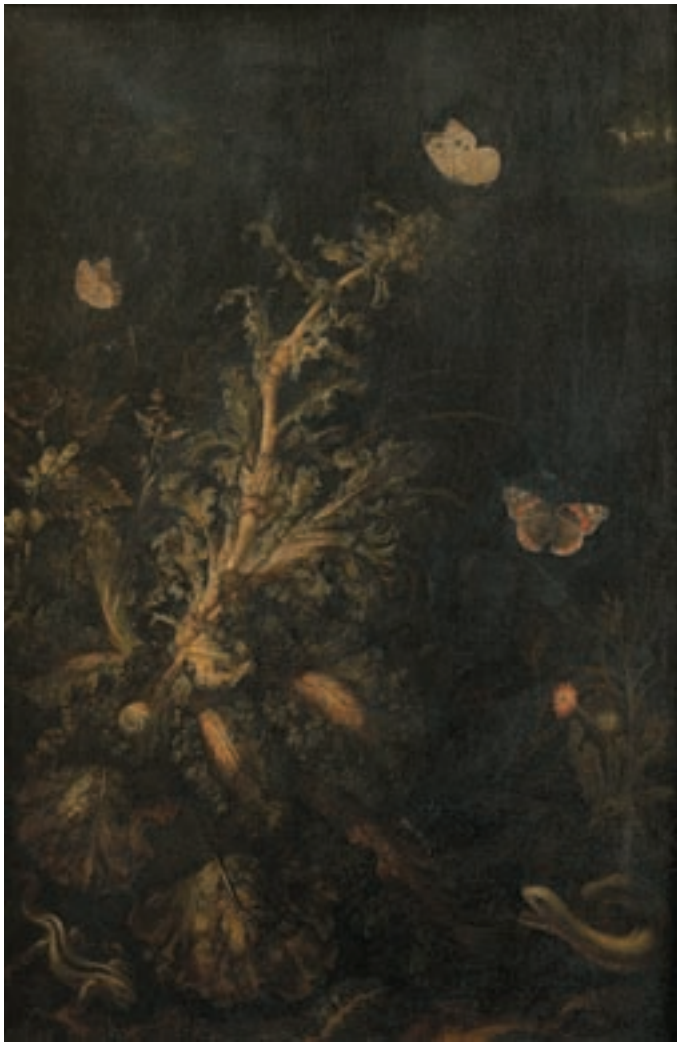
18 Attribué à Otto Marseus van SCHRIECK (1619 - 1678) Serpents et lézards dans un paysage Toile 62 x 40,5 cm