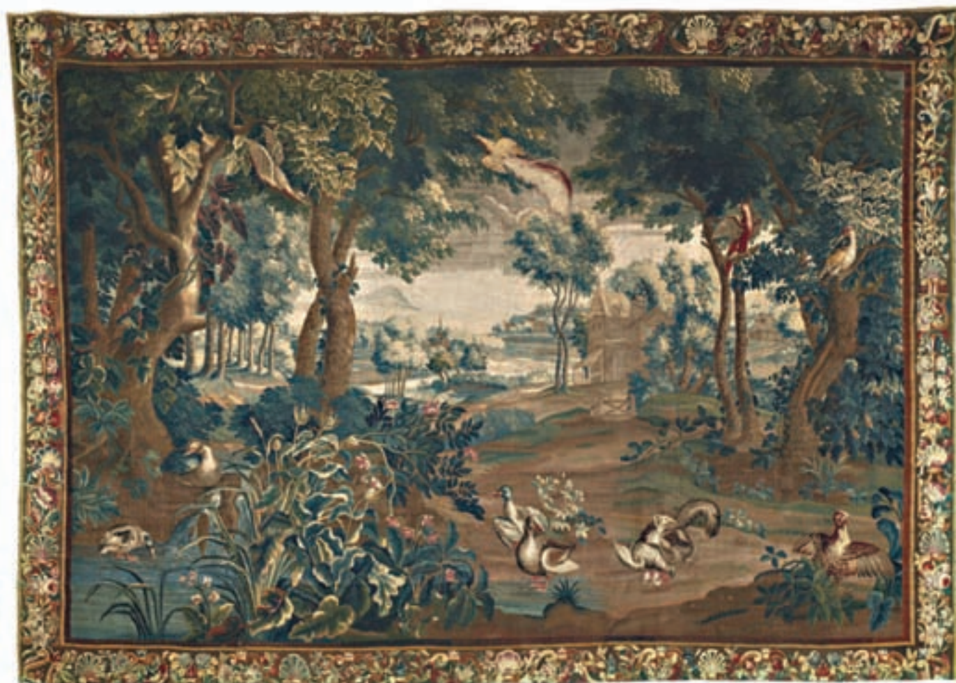
267 TAPISSERIE représentant deux chiens se battant au milieu d'un paysage, entourés de canards et autres volatiles, au fond un cours d'eau et une chaumière, au premier plan à gauche une mare. Bordure de l'époque à décor de fleurs, feuillages et coquilles Flandres. Epoque XVIII ème siècle H : 3 m x L : 4,16 m