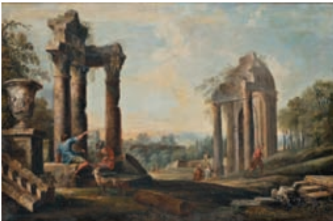
44* Ecole ITALIENNE de la fin du XVIII ème siècle, suiveur de Giovanni Paolo PANINI Bergers près de ruines, Soldats près de ruines Paire de toiles 35 x 51 cm RM 2 000 / 3 000 €