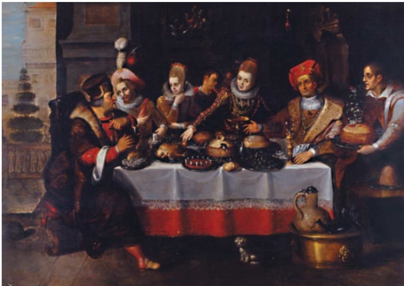
23 ECOLE FLAMANDE du XVII ème siècle, atelier d'Ambrosius FRANCKEN Scène de banquet Panneau de chêne, parqueté 84 x 119 cm Restaurations