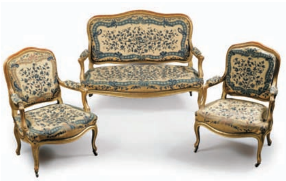
I35 MOBILIER DE SALON à dossier plat en bois doré, mouluré et sculpté d'enroulements. Il repose sur des pieds cambrés agrémentés de roulettes. Il comprend : Un canapé, une paire de fauteuils et quatre chaises. Epoque Napoléon III. (Quelques accidents et manques). Garniture en tapisserie au point à branchages fleuris en camaïeu bleu dans des réserves à rocailles sur un contrefond jaune. (Quelques usures et parties refaites). Canapé H : 102 cm. L : 137 cm. P : 69 cm Fauteuil H : 97 cm. L : 72 cm. P : 60 cm Chaise H : 95 cm. L : 58 cm. P : 61 cm