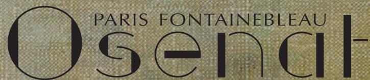
ILLUSTRATION DE LA COUVERTURE :

Lot n° 94 Jean Charles Joseph REMOND (Attribué à) (1795 - 1875) L'Histoire d'Oedipe