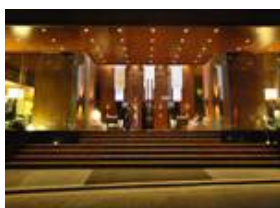
City Garden Grand Hotel 9356