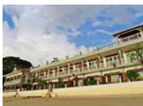
El Nido Beach Hotel 9354