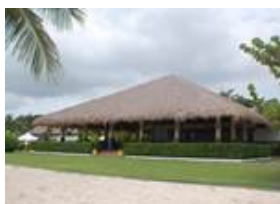
Bohol Beach Club 9354