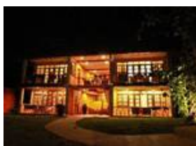
Coco Grove Beach Resort 9354