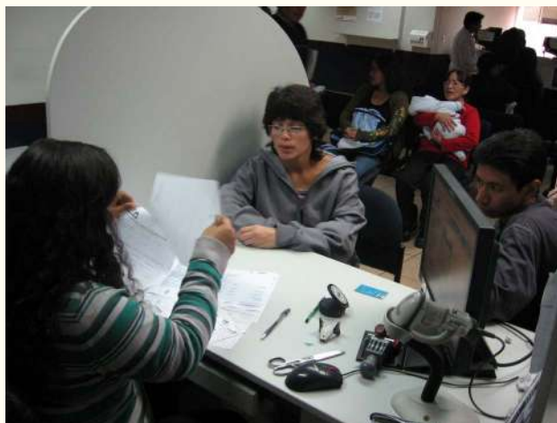
En caso la oficina registral autorizada cuente con registro automatizado en línea y el acta de defunción esté en el SIRCM, el registrador podrá realizar la rectificación del acta en el mismo Sistema.

Cabe señalar que los procedimientos de rectificación de las actas registrales contenidas en el SIRCM, iniciados a pedido de parte, competen en primera instancia a las oficinas registrales RENIEC; en ese sentido, emplean los títulos archivados en el Archivo Registral del RENIEC como sustento para la rectificación administrativa.