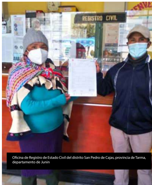
Oficina de Registro de Estado Civil del distrito San Pedro de Cajas, provincia de Tarma, departamento de Junín