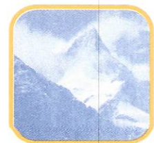
NEVADO DE PARIACACA