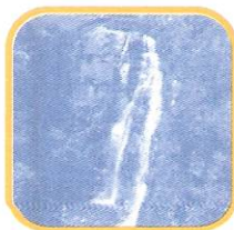
CATARATA DE ANTANKALLO