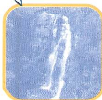
CATARATA DE ANTANKALLO