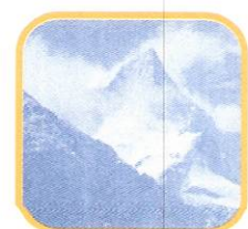
NEVADO DE PARIACACA