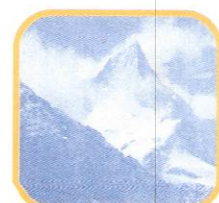
NEVADO DE PARIACACA