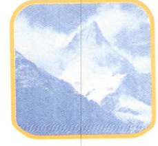
NEVADO DE PARIACACA