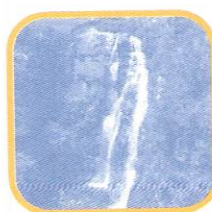
CATARATA DE ANTANKALLO