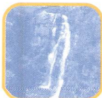
CATARATA DE ANTANKALLO