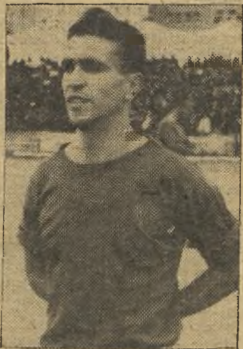
Durán estuvo entre los destacados cacereñistas

dra de Peláez. 4-0. Y muchos aplausos por la belleza del gol.