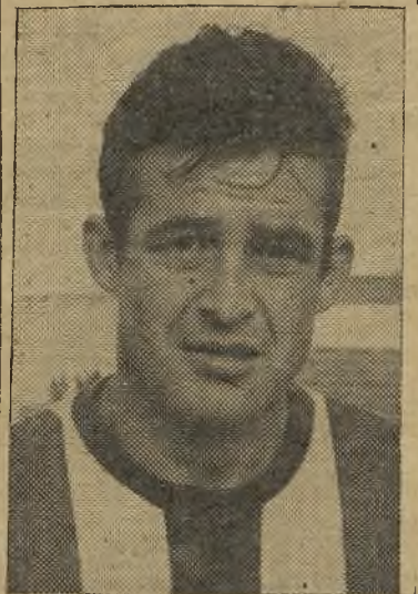
Cacereño, uno de los más distinguidos del Talavera

ma instancia ceden constantemente balones a córner. Cuando tienen ocasión de ello también se lanzan al ataque, con mucha