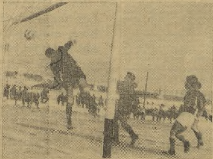
Así se produjo el único gol del Socuellamos.

el Femsa; continuó la presión local, pero siguió, también, la inoperancia e ineficacia de los delanteros azul socuellaminos. El encuentro no tuvo más brillantez que la de la excelente tarde y el consiguiente disgusto. Destacaron por el Femsa, Hernández, Cantalapiedra, Pérez, Serrano. Por el Socuellamos, Palero, sobre todos, siguiéndole en