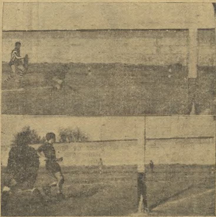
También los de Tercera Regional tienen su corazoncito. Y el Cripitanense goleó al Tarancón. En las fotos de Díaz Hellín, arriba uno de los siete goles locales. Abajo, otro de la serie.