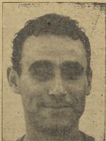
Anta, el único que se salva del naufragio

del solitario gol marcado en lo que va de Liga. Esto nos recuerda cierta crónica escrita por nosotros en la anterior estancia del Badajoz en Segunda División, y no que-