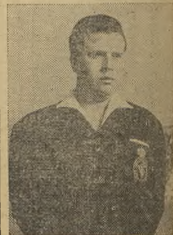
Sr. Romero Los grupos XIV y XV de Tercera División. Actualmente, la tabla es la siguiente:

Transcurrido ya el primer mes de la competición liguera, vamos a ofrecer a ustedes la clasificación de los árbitros que pitan en