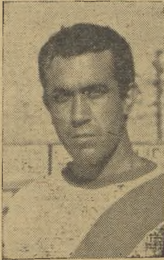
Trujillo, destacado, pero también lesionado

muy buena impresión, no adoptó la táctica preferentemente defensiva tan en boga en la ma-