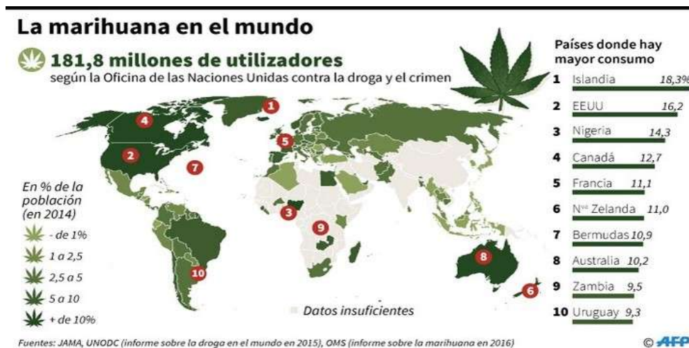
Figura 1. Uso de cannabis (marihuana) en el mundo

En la Figura 1 se muestra el uso de cannabis a nivel mundial donde Canadá ocupa el cuarto sitio.