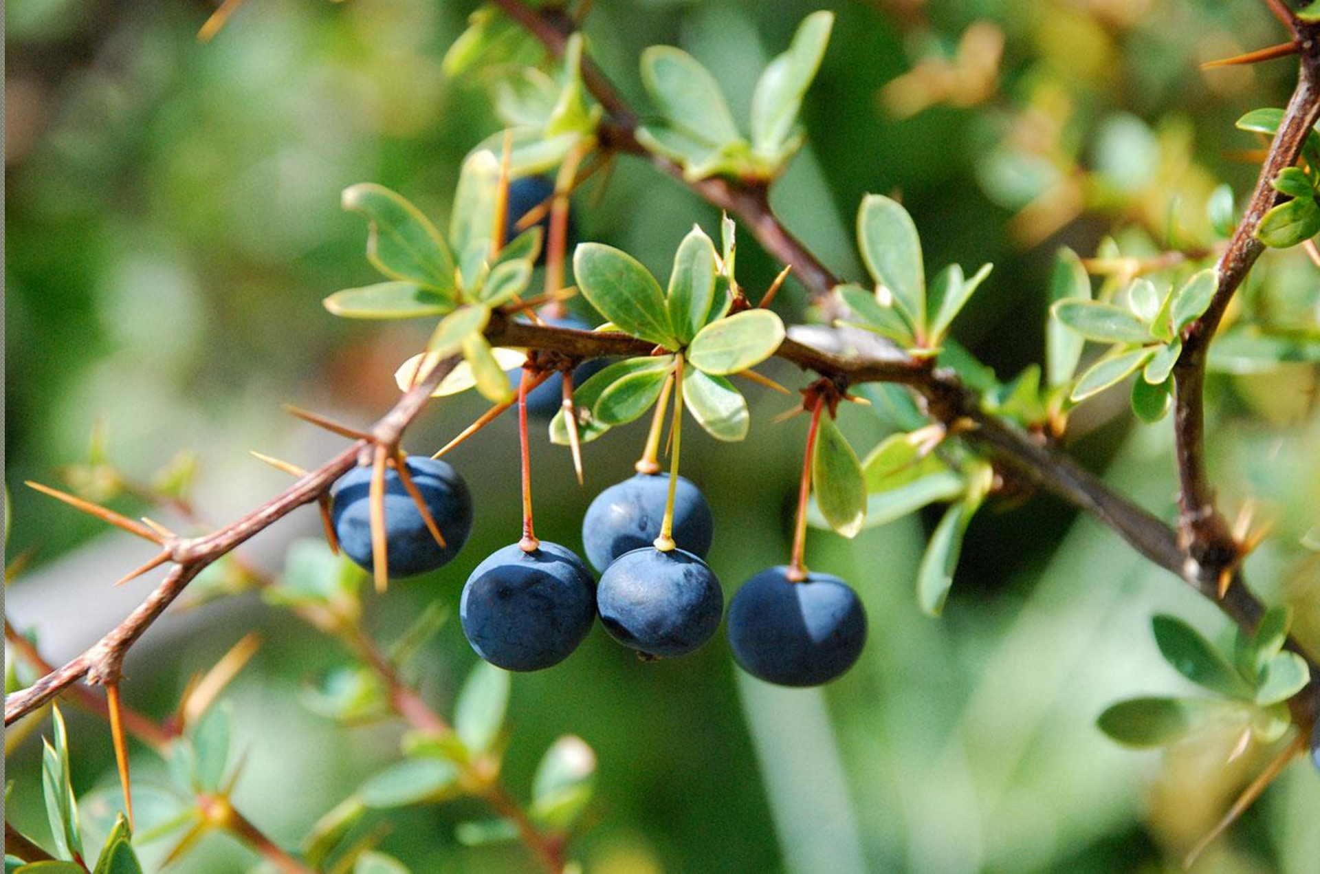
Berberis heterophylla (Calafate)