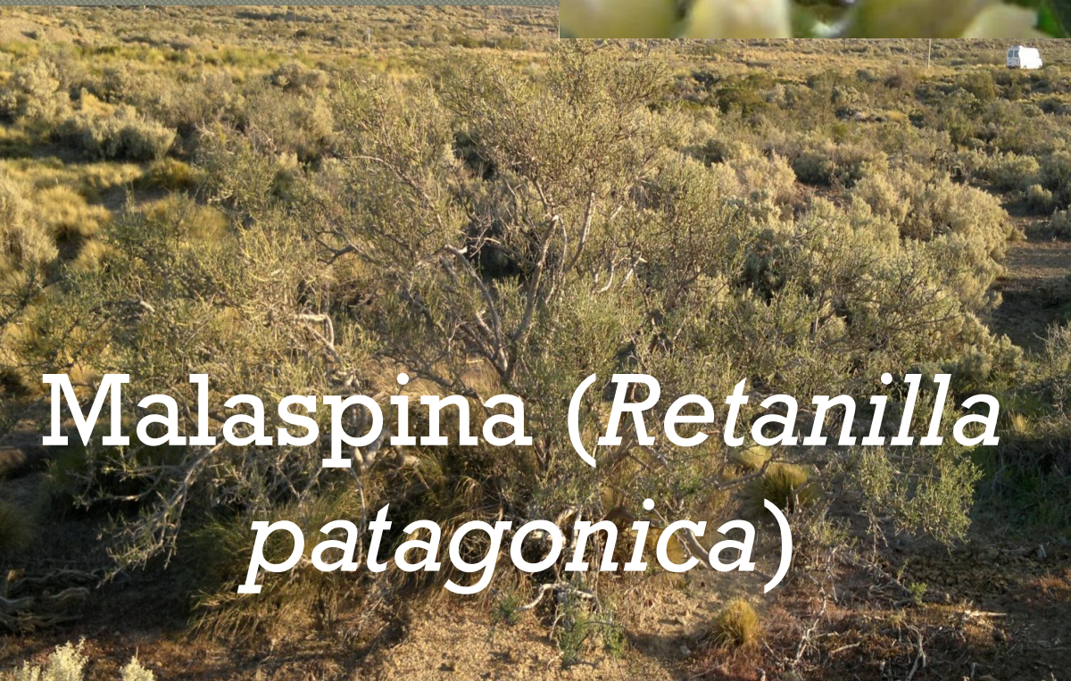
Malaspina ( Retanilla patagonica )