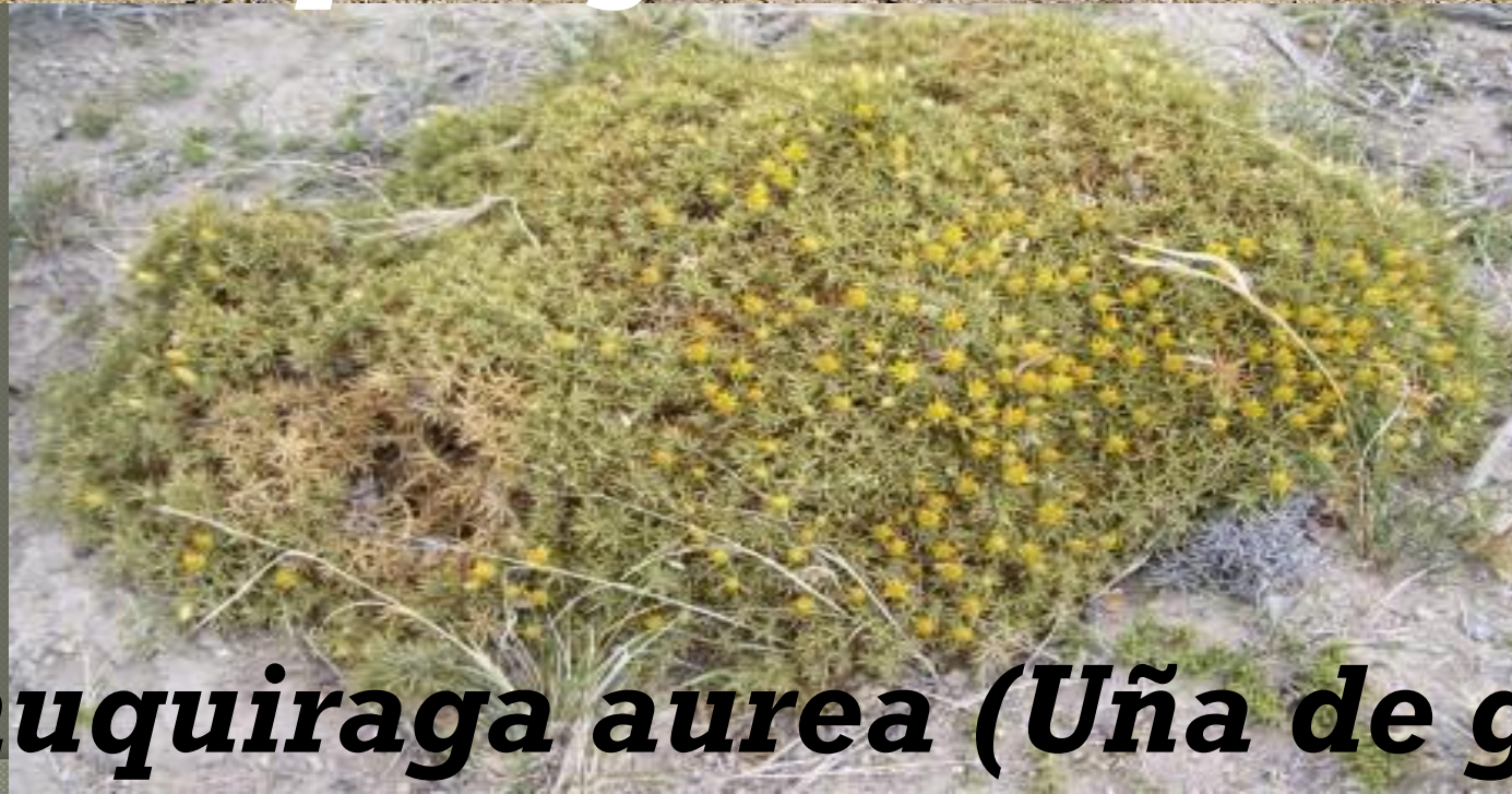
Chuquiraga aurea (Uña de gato)