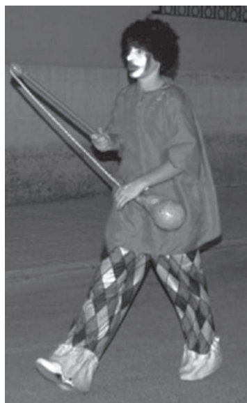
Pinchaúvas en agosto de 2007.