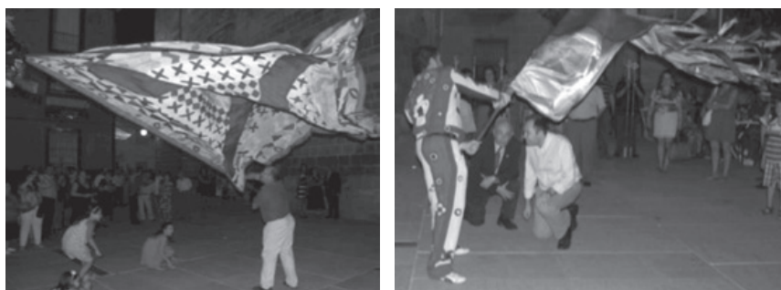
Las banderas de Jimena y de Guadix son tremoladas en la plaza de Cabra al término de la procesión del pasado 15 de agosto de 2012.