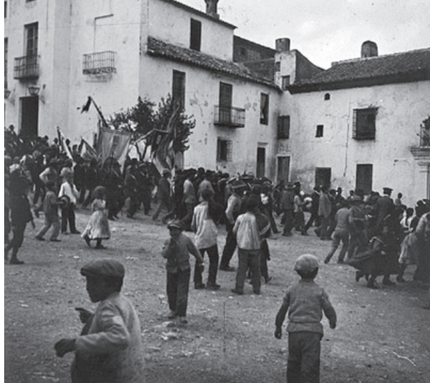
Son diversas las fotos de Cerdá en las que se aprecia esa expectación entre los niños.