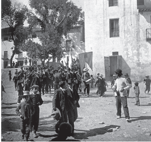
Septiembre de 1906, la comitiva parte desde el Ayuntamiento hacia la Parroquia. En primer término, a la derecha posiblemente se trate de Pinchaúvas.