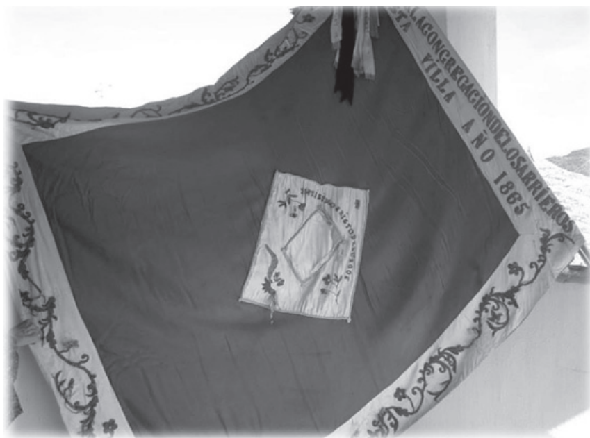
Bandera de Arrieros.