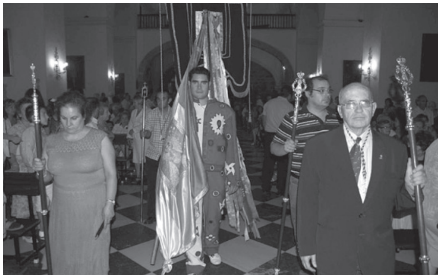
Procesión del Cristo de Burgos del 15-8/2012 en Cabra del Santo Cristo. Cascamorras junto al Hermano Mayor y representantes de la cofradía de la Piedad de Guadix.

...que de las cofradías que se hubieren de fundar y fundaren en la dicha iglesia de Cabrilla a contemplación y devoción de la dicha Santa Imagen, se ha de dar a la ciudad de Guadix en nombre de dicho don Gerónimo el primer lugar, á la dicha Cofradía de Guadix que la dicha ciudad quisiere fundar después de los clérigos de esta Villa y ha de salir a recibirla todos los años cuando venga a hacer la fiesta principal que ha de ser á catorce de septiembre de cada año el dicho Prior y Clerecía con la cruz y estandarte a la puerta de la dicha Iglesia de esta Villa á donde por el mismo acompañamiento se ha de volver a despedir, acabada la fiesta y a la dicha cofradía se ha de dar preferencia de más antigua porque así es la voluntad del dicho Don Gerónimo"... ...salgan las demás cofradías a recibirla con sus estandartes á la Ermita de la Nuestra Señora la Virgen del Rosario y el Prior y Clérigos a la puerta de la Iglesia, viniendo la dicha cofradía con su estandarte y no de otra manera.