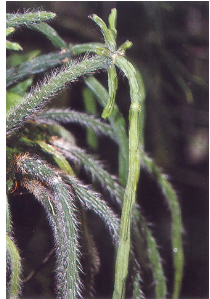
Rhipsalis paradoxa (mostrando tallos dimorfos)