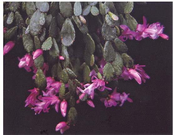
Schlumbergera opuntiooides ssp. epiphylloides (con frutos)