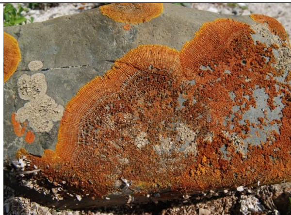
Follmannia orthoclada (autor Reinaldo Vargas)