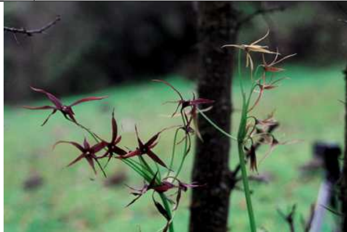
Gethyum atropurpureum