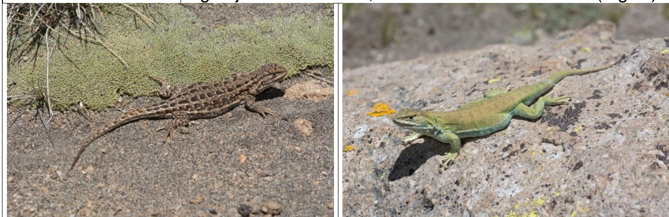
Arriba fotografías Liolaemus pleopholis, Izquierda: hembra, derecha: macho