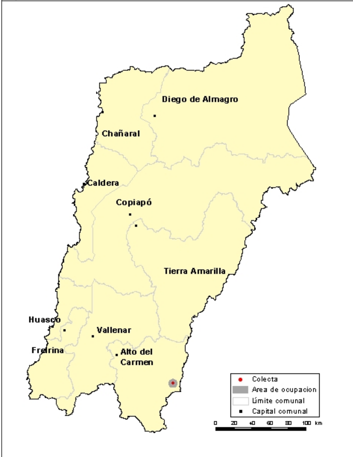
Figura 2: Mapa indicando la única localidad conocida para Menonvillea macrocarpa .