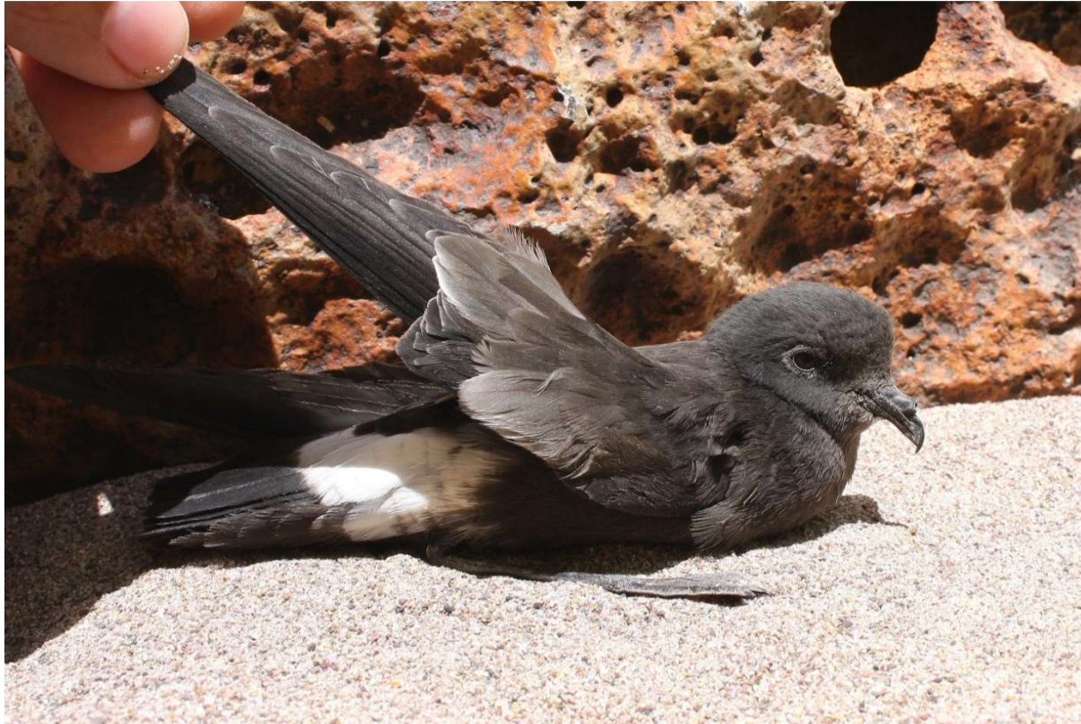
Fotografía de Oceanites gracilis