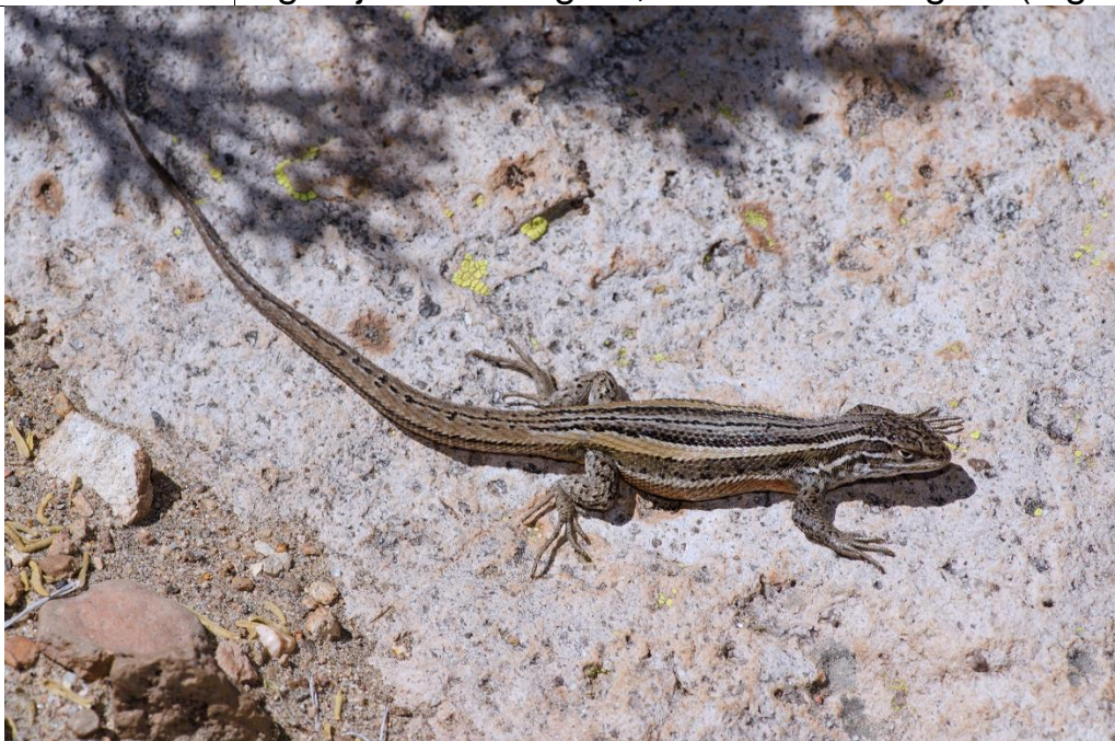
Fotografía Liolaemus chungara