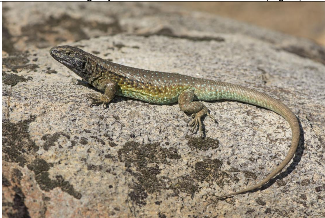
Fotografía Liolaemus leftrarui