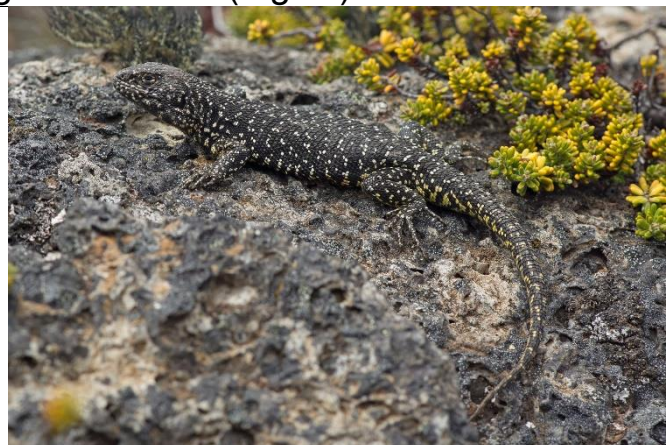
Arriba fotografías Liolaemus sarmiento Izquierda: hembra, derecha: macho