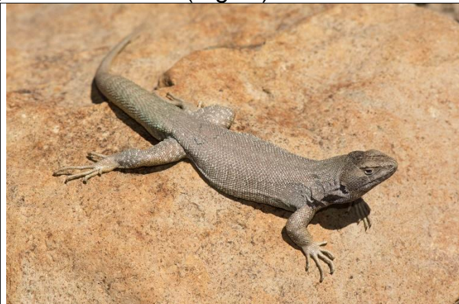
Arriba fotografías Liolaemus uniformis