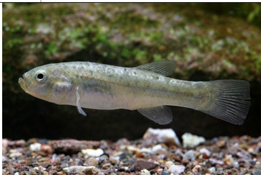
Figura 1. Orestias gloriae