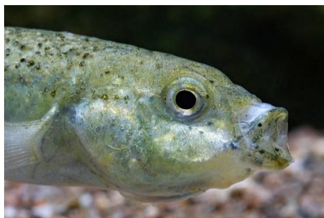
Figura 2. Orestias gloriae