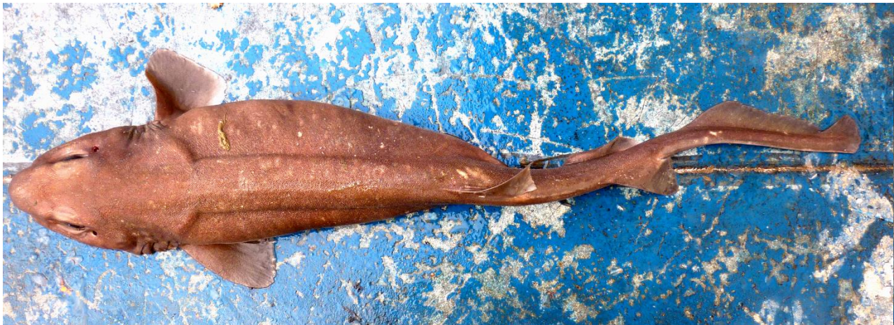
Vista lateral y dorsal de Bythaelurus canescens , hembra