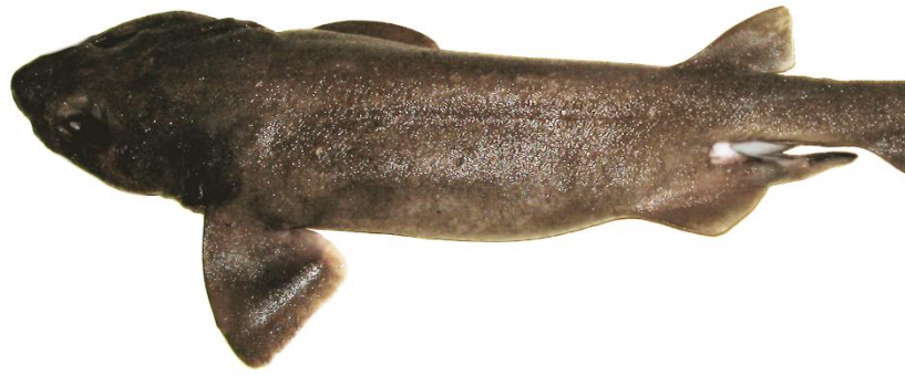
Vista lateral de Bythaelurus canescens , macho adulto, Valdivia. I