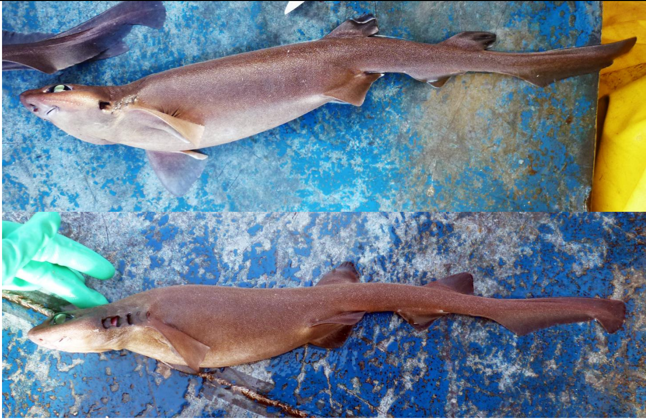
Vista lateral de Bythaelurus canescens , hembra juv