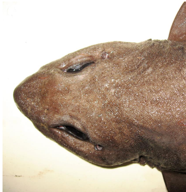
Detalle dorsal de la cabeza de Bythaelurus canescens , m