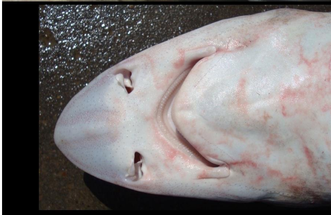
Detalle lateral y ventral de la cabeza de Mustelus whitneyi , Tumbes, Perú.