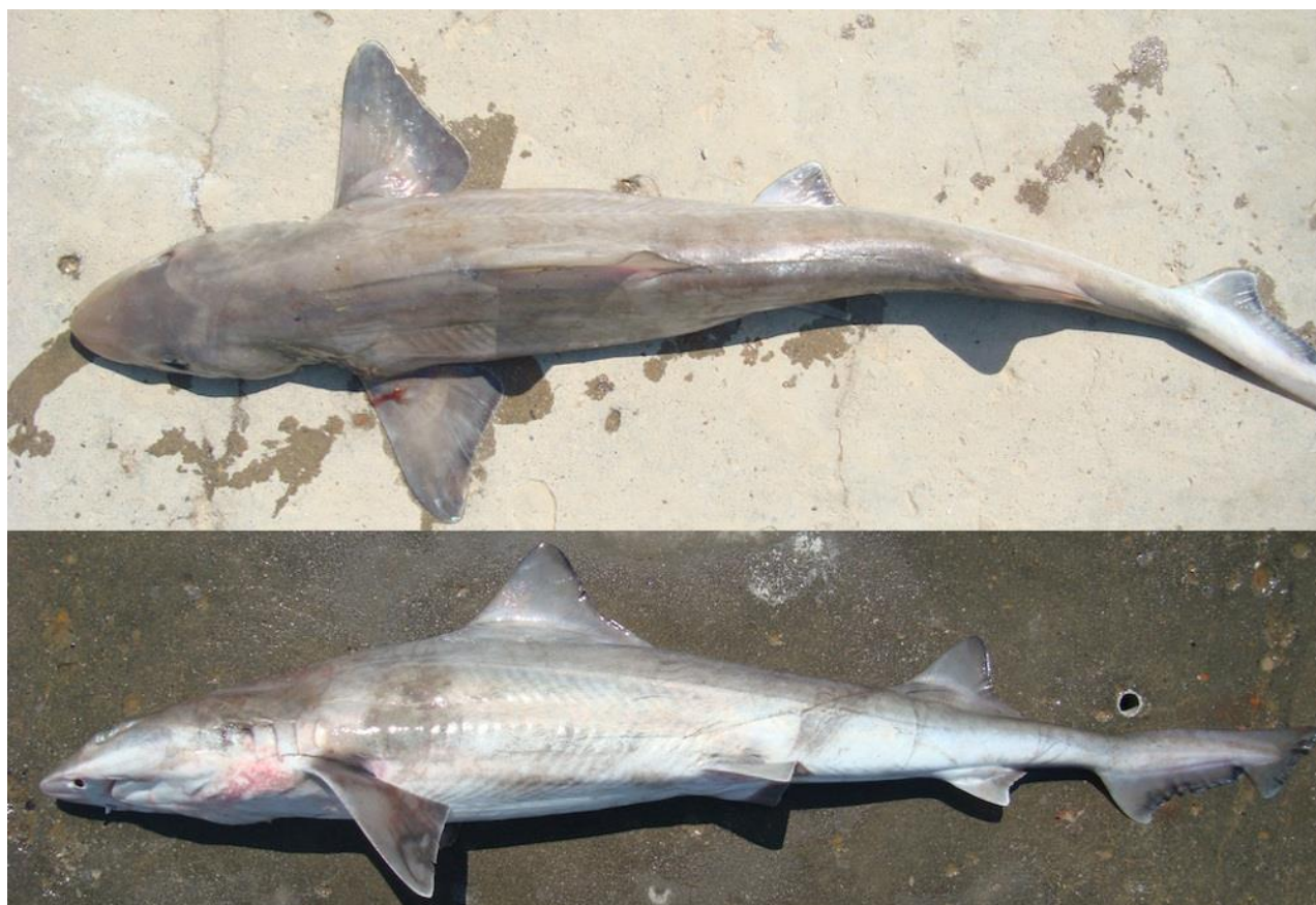
Vista dorsal y lateral de Mustelus whitneyi , Tumbes, Perú.