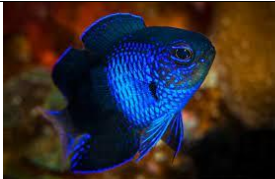
Chrysiptera rapanui