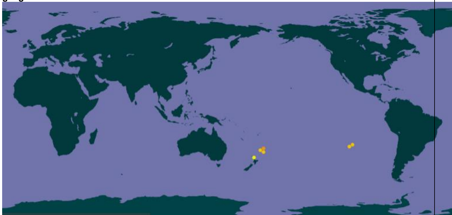
Figura 1. Chrysiptera rapanui se distribuye en el sudoeste del Pacífico en las islas Kermadec, Nueva Zelanda y al sudeste del Pacífico en Chile en Rapa Nui (Base de datos GBIF, 1958-2013) y en Islas Salas y Gómez (Natgeo y Oceana 2011). Presente en las siguientes Áreas Marinas Protegidas: PM Motu Motiro Hiva y AMCP-MU Rapa Nui.