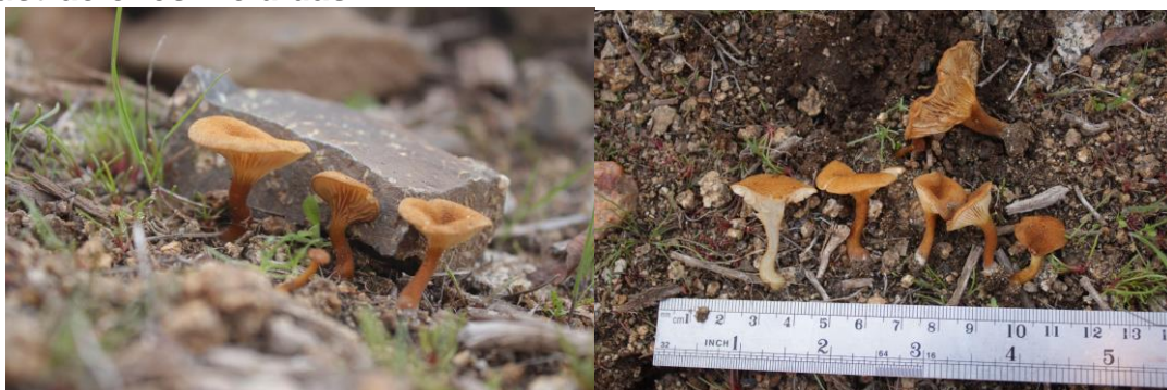
Figura 1: Basidiomas in situ de M. omphaliopsis. (Imágenes pueden ser utilizadas mientras se señala la autoría).